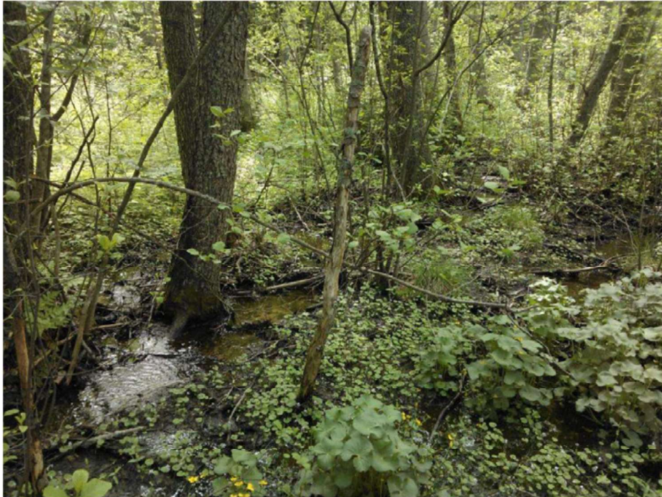
Kuva 2. Kohteessa 1 Haravankylässä sijaitsee monilajinen lehto, jonka läpi virtaa puro. Puro leviää paikoin lähteiköksi. Kohde kuuluu sekä metsä- että vesilain suojeltuihin luontotyyppeihin.

Kohteen läntisellä puolella OMaT-lehdossa pääpuulajina on kuusi. Kenttäkerroksen lajistossa valtalajeina ovat käenkaali, oravanmarja, kielo, korpi-imarre ja metsäimarre. Valkovuokko ja metsäalvejuuri kasvavat paikoin. Huomionarvoisena lajina kuviolla kasvaa myös kaiheorvokki Viola selkirkii , joka on harvinainen, mutta valtakunnallisesti ja alueellisesti kuitenkin elinvoimainen.