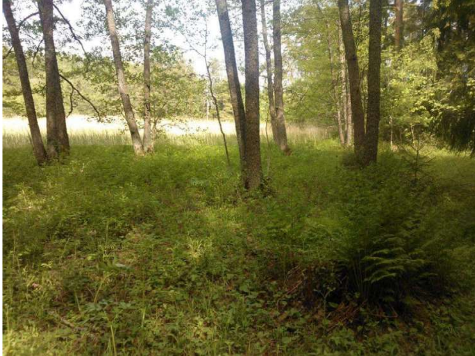
Kuva 5. Tavastholmenin rehevä runsaslajinen LT-lehto kuviolla 4 a, jolla kasvaa mm. kaihe-orvokki ja kevättähtimö.