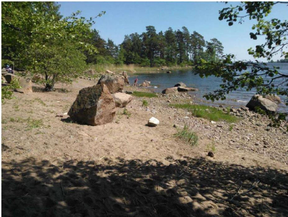
Kuva 7. Luonnontilaisella hiekkarannalla kuviolla 4 d kasvaa mm. merinätkelmä ja meriluikka. Kohde kuuluu luonnonsuojelulain suojeltaviin kohteisiin ja on lisäksi erittäin uhanalainen luontotyyppi.

Kuviolla 4 d on luonnontilainen hiekkaranta, jolla on huomionarvoista kasvillisuutta. Hiekalla kasvaa mm. merinätkelmä Lathyrus japonicus , meriluikka, rantavehänä ja kuvion reuna-alueilla lisäksi rantatyräkki Euphorbia palustris . Kuvio on pienialainen ja osittain kivinen, mutta suhteellisen luonnontilainen vähäisestä virkistyskäytöstä huolimatta. Merinätkelmä on huomionarvoinen ja melko harvinainen rannikon hiekkarantojen laji.