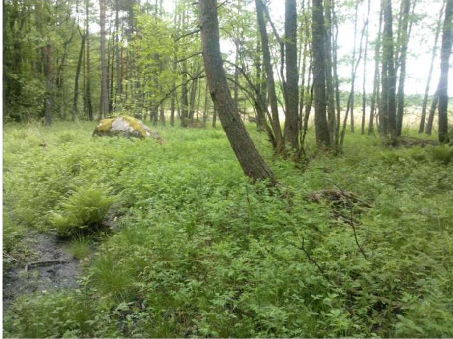
Kuva 4. Braskvikenin (kohde 3) pohjukassa on samoin puna-ailakkityypin luonnontilainen LT-lehto.