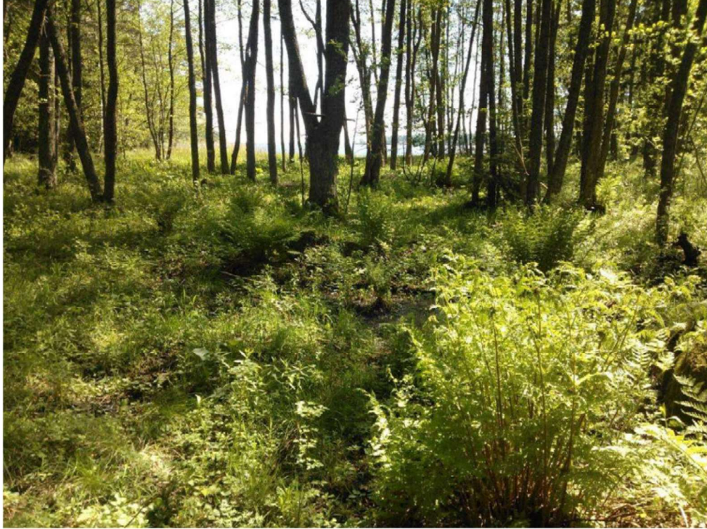
Kuva 9. Tervaleppälehtoa kuviolla 4 f, joka paikoittain vaihettuu tervaleppäkorveksi (kuvio 4 e, kuva 8).