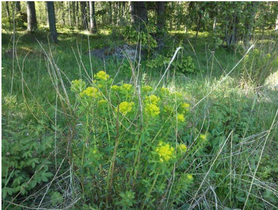
Kuva 6. Rantatyräkki kasvaa kuviolla 4 b Tavastholmenilla monin paikoin rantalehdon ja kangasmetsän välivyöhykkeellä.