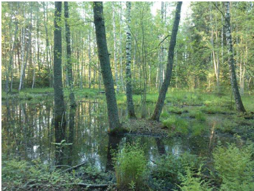
Kuva 11. Tervaleppäkorvessa kuviolla 5 c vesi makaa osan vuodesta korven pohjalla muo- dostaen allikoita mättäiden välille ja luoden ravinteisen kasvupaikan.