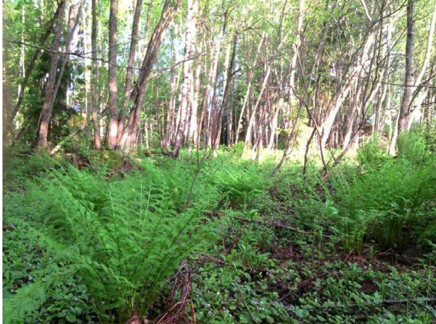
Kuva 10. Rehevä lehto asutuksen ja rannan välissä kuviolla 5 b. Hiirenporras ja suo- orvokki ovat paikoin runsaita.

lehdon lajistoa. Tervalepät ovat keskimäärin nuoria (halkaisijaltaan alle 20 cm) ja maalaho- puuta esiintyy paikoin. Lisäksi kuvion reunoilla kasvaa vähän pihlajaa, kuusta ja koivua. Kenttäkerroksessa kasvaa mm. puna-ailakki, jänönsalaatti, oravanmarja, hiirenporras, kai- heorvokki Viola selkirkii , suo-orvokki, rantakukka, lehtovirmajuuri, kurjenjalka, mesianger- vo, sormisara, tuoksusimake, rentukka, suoputki ja rannassa rantatyräkki Euphorbia pa- lustris .