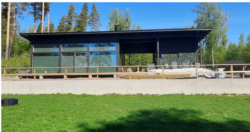
Bild 6. Den nya fritidsbostaden från strandhållet.