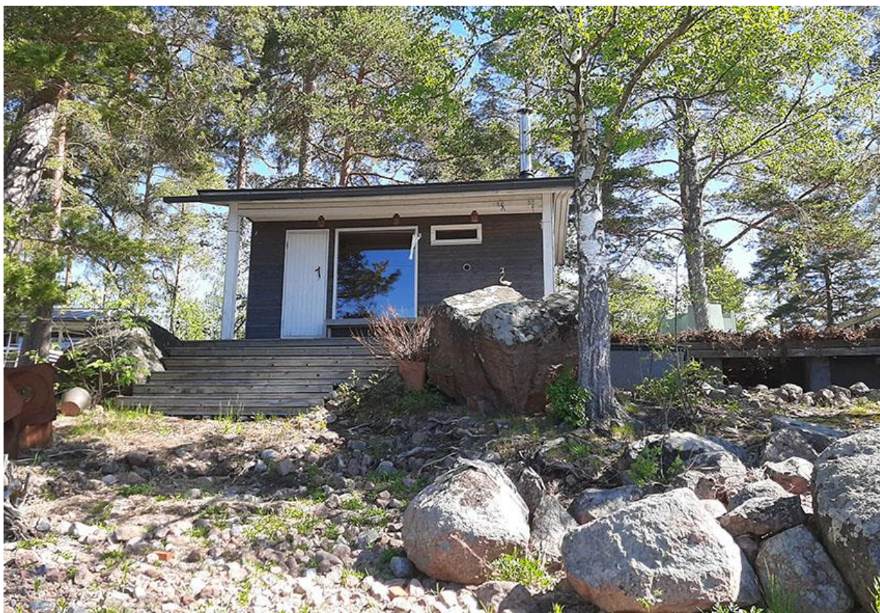
Bild 2. Bastun forograferad från strandhållet.