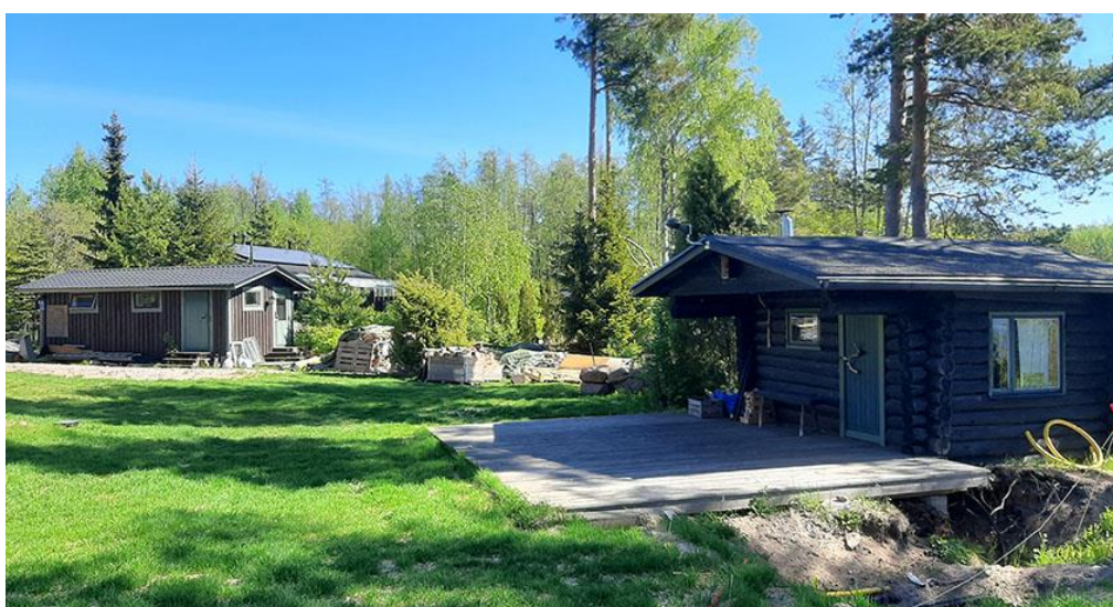
Bild 7. Bastun till höger, och lidret.