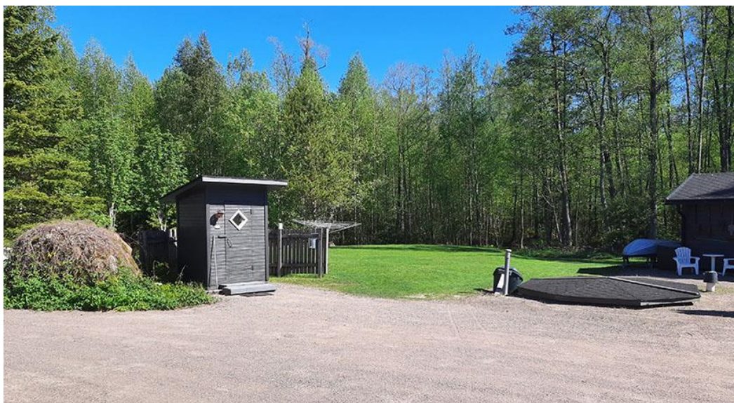
Bild 11. Lidret på den förra bilden i den högra kanten, dasset i mitten på bilden.