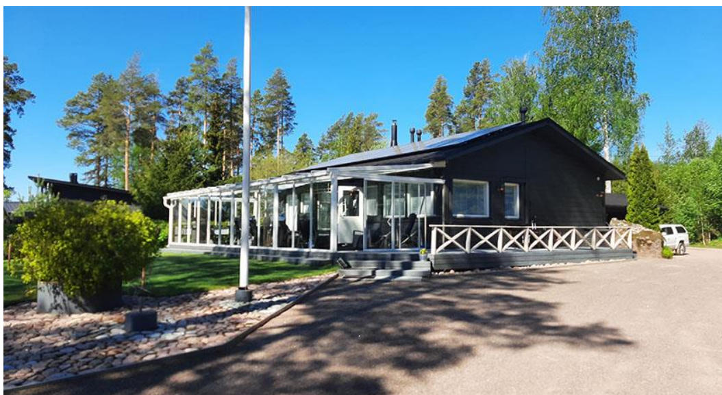
Bild 12. Fritidsbostaden fotograferad från bastuhållet.