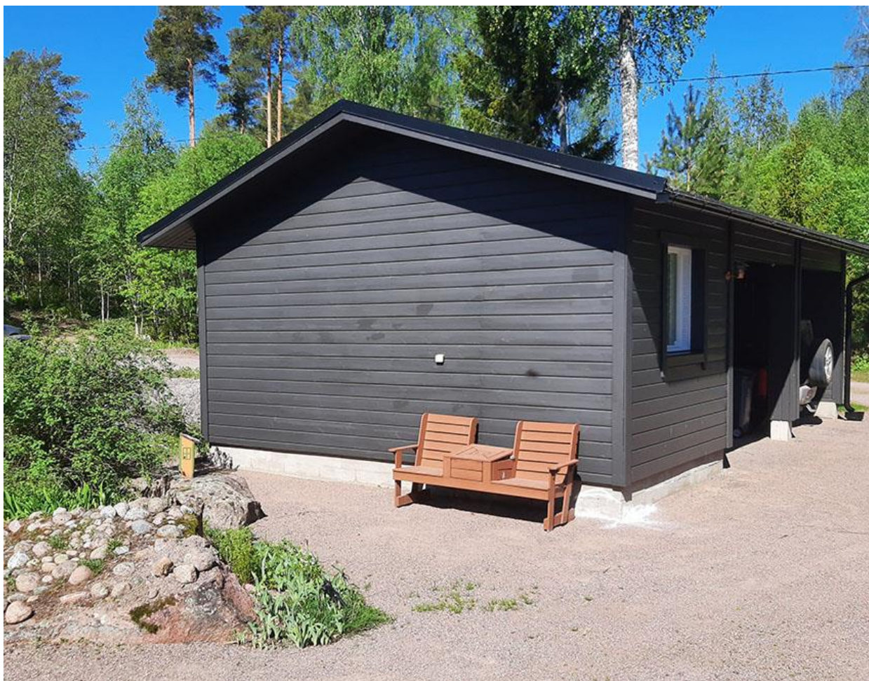
Bild 14. Lider-biltak.