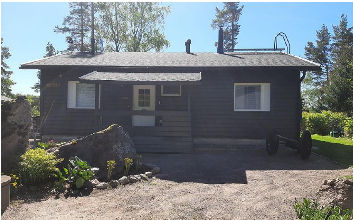
Bild 13. Fritidsbostadens fasad mot norr.