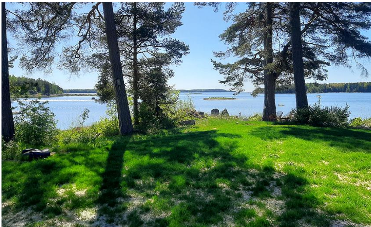
Bild 8. Havslandskapet i fotograferat i mitten på byggplatsen.