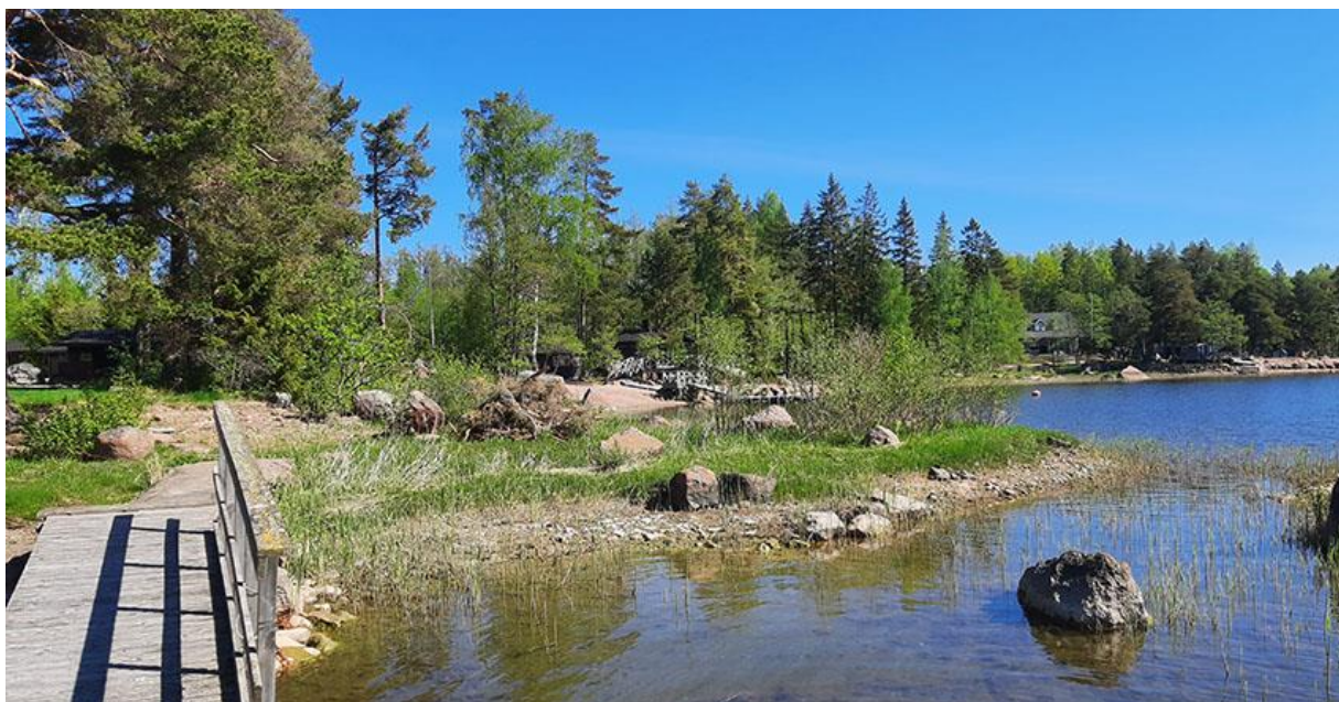
Bild 15. Strandlandskapet vid byggplats 3 fotograferat från bryggan på byggplats. Bastun syns i mitten på bilden, grannens fritidsbostad på den högra sidan.