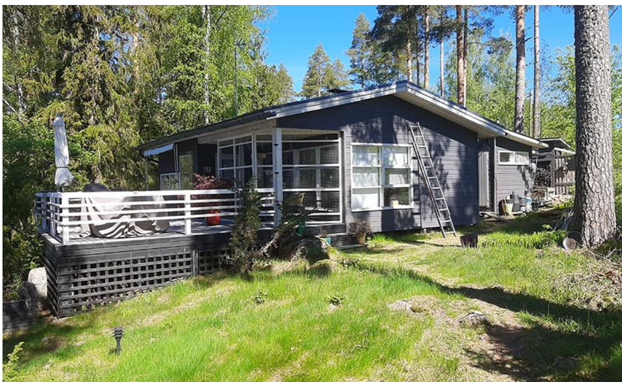
Bild 4. Fritidsbostaden fotograferad från sydväst.