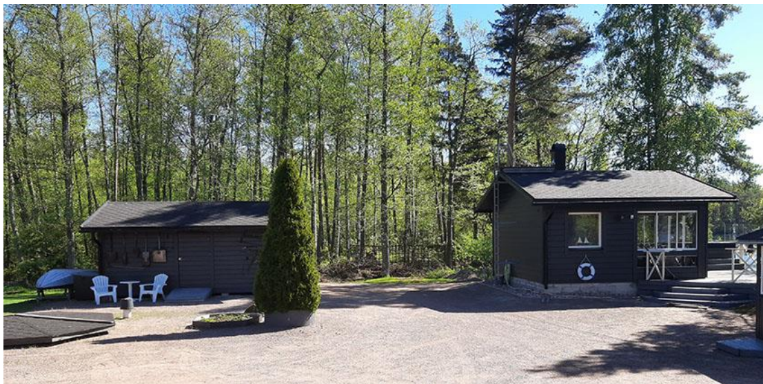
Bild 10. Strandbastun och till vänster lidret.