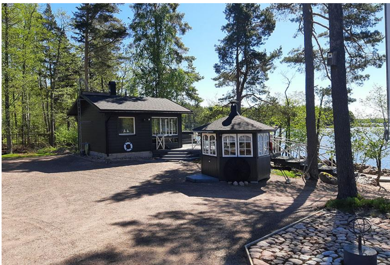
Bild 9. Strandbastun och minipaviljongen.