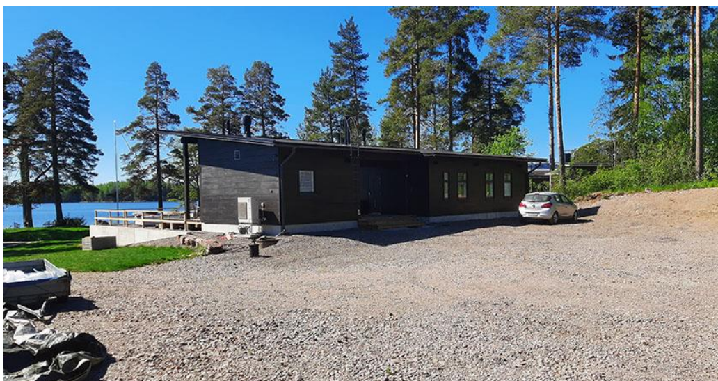
Bild 5. Den nyligen färdigställda fritidsbostaden.