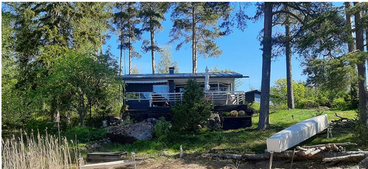
Bild 3. Fritidsbostaden fotograferad från stranden.