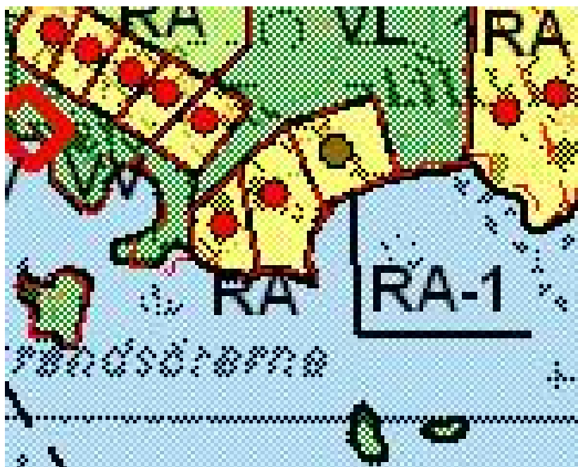
Utdrag ur den gällande stranddelgeneralplanen för Kulla-Lappom.

För området gäller stranddelgeneralplanen för Kulla-Lappom, som godkännts 24.2.2003. I planen är stranddetaljplaneområdet som ska ändras anvisats för fritidsbebyggelse med 3 fritidstomter. Byggrätten är anvisad med effektivitetstalet e=0,05 , dock högst med 250 m 2 våningsyta. Byggrätten för fastighetstomten 7-7 är anvisad i enlighet med den gällande stranddetaljplanen.