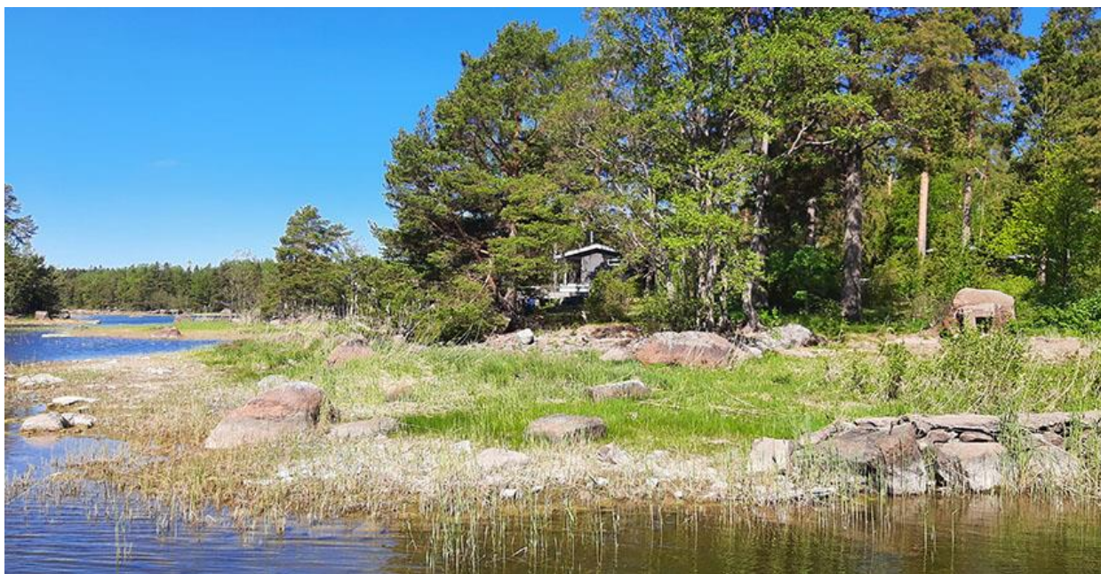
Bild 1. Byggplatsens strandlandskap.