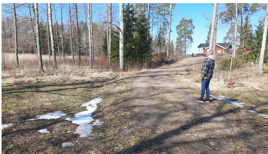
Bild 6. Infarten till byggplats 1. Området till vänster är anvisat som MY-1 område. Markägaren med på bilden.