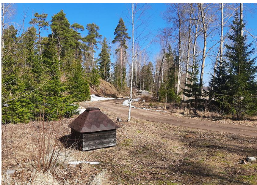
Bild 5. Infartsvägen till byggplats 2 längs den östra stranden av Storholmen.