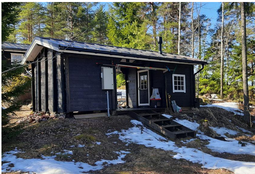
Bild 11. Lidret norr om stugan på byggplats 2.