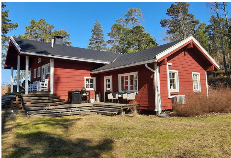
Bild 1. Fritidsstugan på byggplats 1.