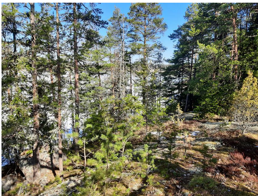
Bild 3. Strandvegetationen norr om stugan på byggplats 1.