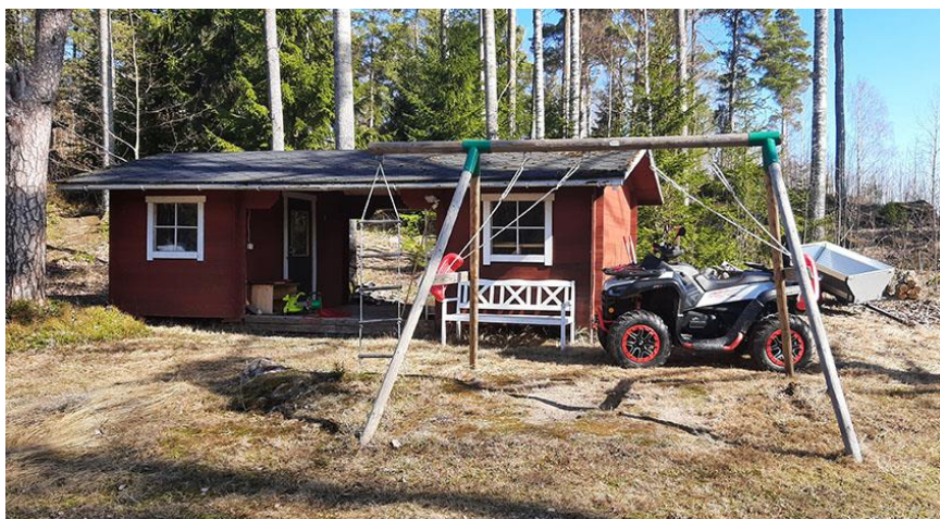
Bild 2. Lidret på byggplats 1.