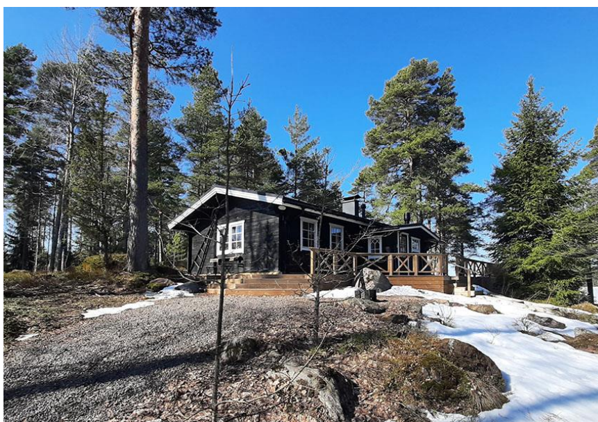
Bild 9. Fritidsstugan på byggplats 2.