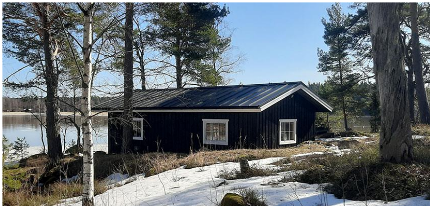
Bild 13. Båthuset på den nordöstra udden på byggplats 2.