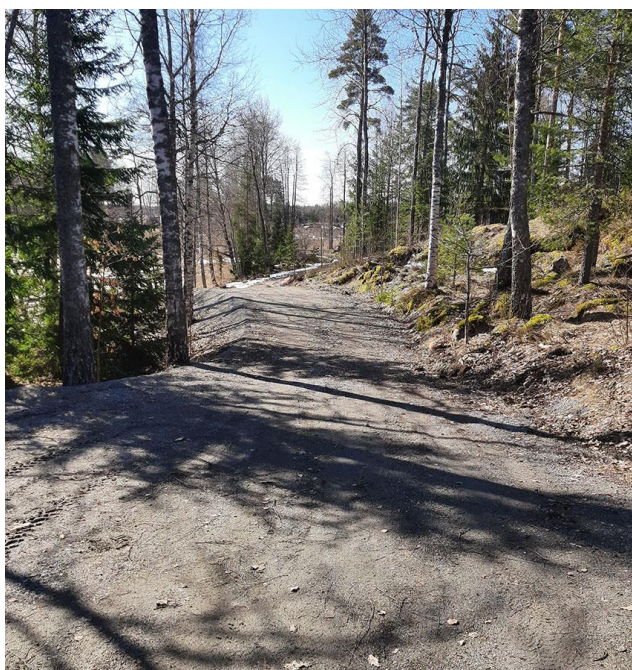
Bild 15. Väginfarten till byggplats 2 mot söder, vägen södra del finns avbildad på bild 5.