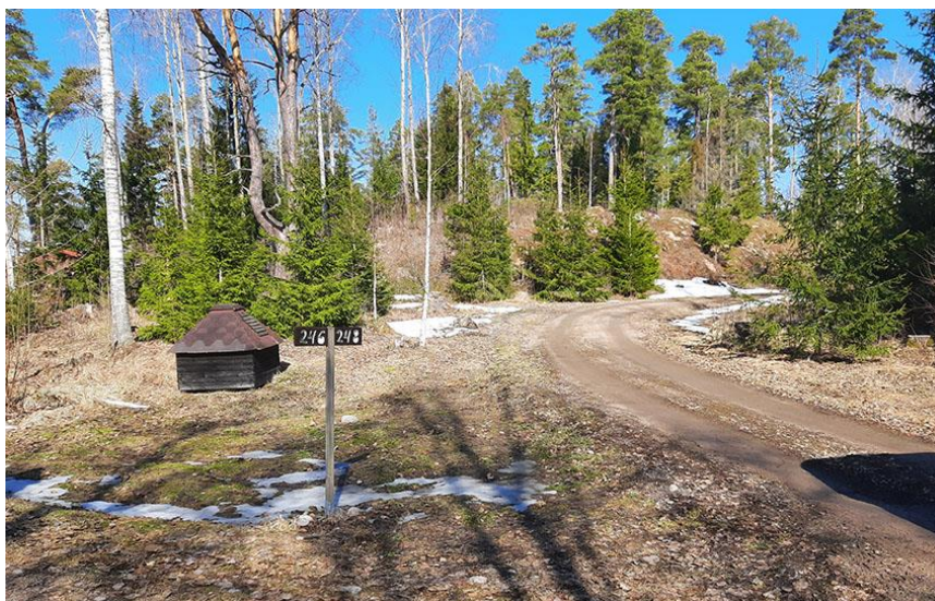
Bild 4. Byggnadsytan på kullen på byggplats 1 avbildad från söder vid infartsvägen.