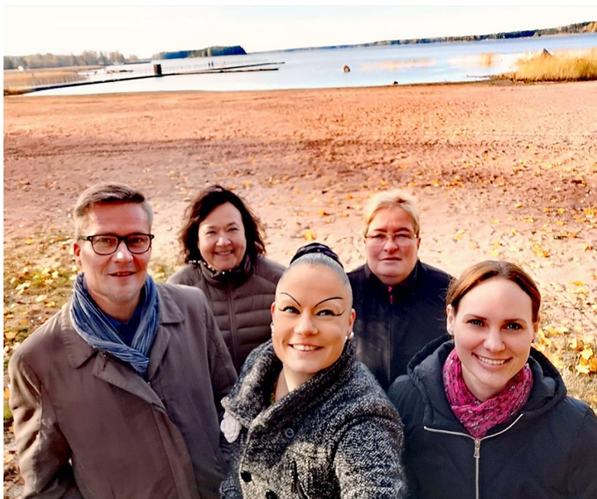
BILD 4: Personalförvaltningsteamet (HR-teamet) med gott mod mot nya och intressanta arbetsutmaningar.