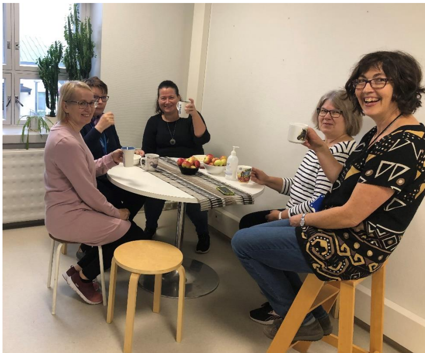
BILD 2: Piggar upp arbetsdagen – centralen för näringsliv och infrastrukturens glada kontors-sällskap dricker kaffe tillsammans i lokalservicens, byggnadstillsynens och miljövårdens nya lokaler.