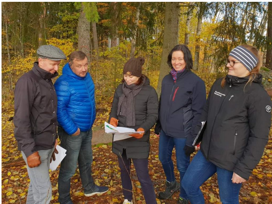
BILD 3: Med en bra början är halva jobbet gjort – förberedelsearbetet inför 2023 års bostadsmässa framskrider som planerat