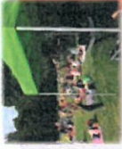
Mätarna fastställs i budgeten)