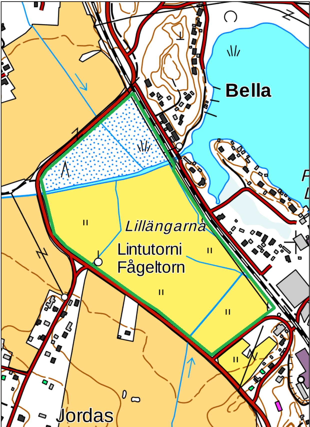
Kuva 5. Viitasammakon elinympäristörajaus Lillängarnan alueella. Kartta © Maanmittauslaitos