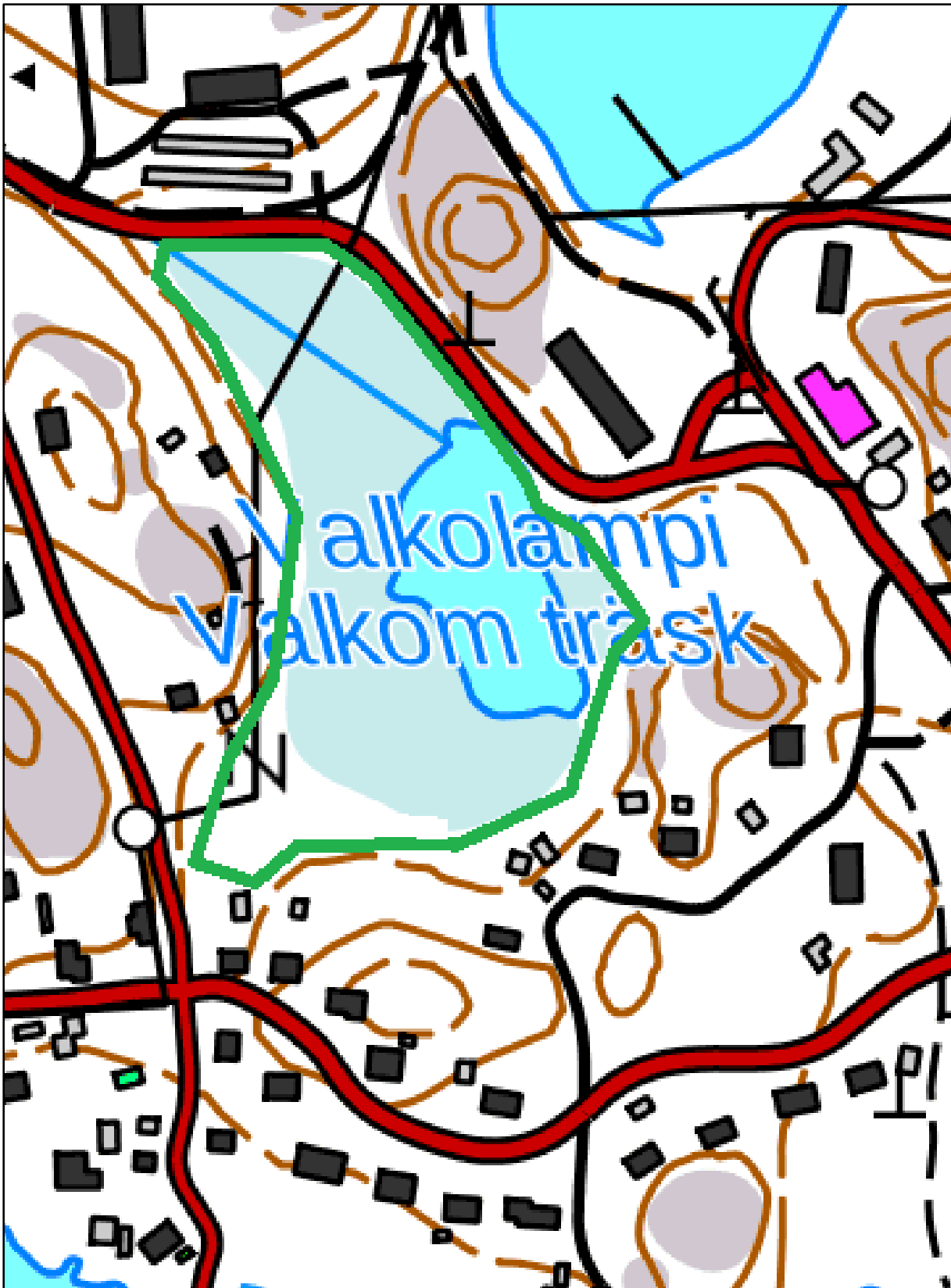
Kuva 4. Viitasammakon elinympäristörajaus Valkolammella. Kartta © Maanmittauslaitos