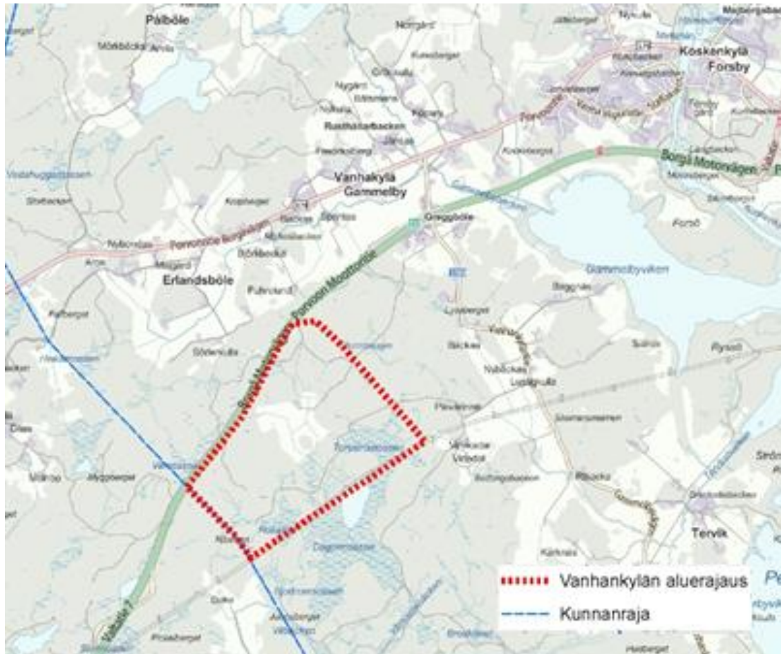
Figur 3. Läget för Gammelby planeringsområde.

Ett projekt som eventuellt kan bidra till kumulativa effekter är Gammelby vindkraftspark, som planeras väster om Gammelbyviken, som ligger i Pernåviken. För området utarbetas en delgeneralplan som ska möjliggöra byggande av vindkraft på området. Delgeneralplanen är under beredning och 8 vindkraftverk planeras preliminärt på området. Planeringsområdet i Gammelby ligger 2,4 km väster om Gammelbyviken, som ingår i Naturaområdet, och 7 km sydväst om planeringsområdet i Tetom.