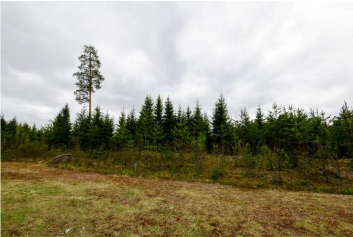
Kraftverk nr 8 placeras på en backe vid ändan av skogsvägen. Foto från norr. (AKDG4244:7)