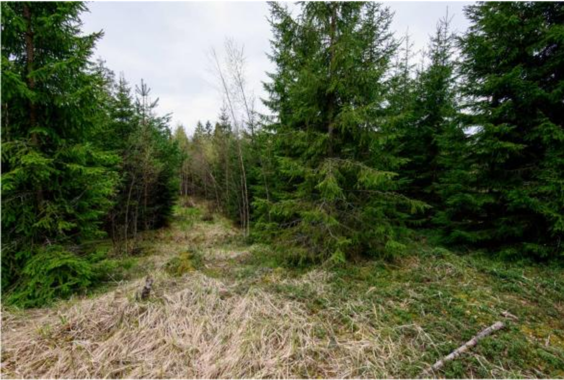
Kraftverk nr 3 placeras i en tät, ung blandskog. AKDG4244:5