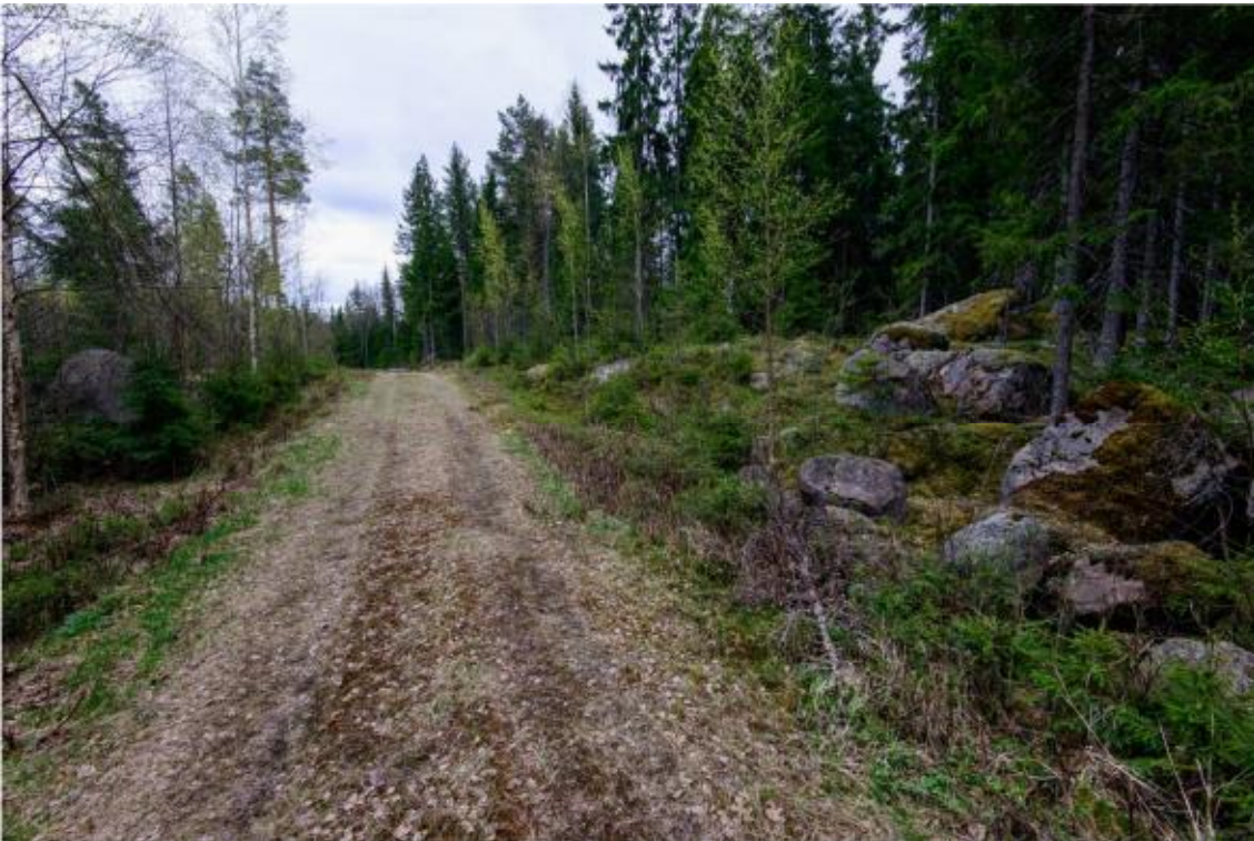
Skogsbilväg vid kraftverk 7. Foto från nordväst. (AKDG4244:9)