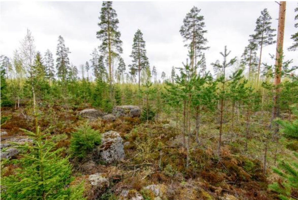
Kraftverk nr 4, landskapet från kraftverket söderut. (AKDG4244:2)