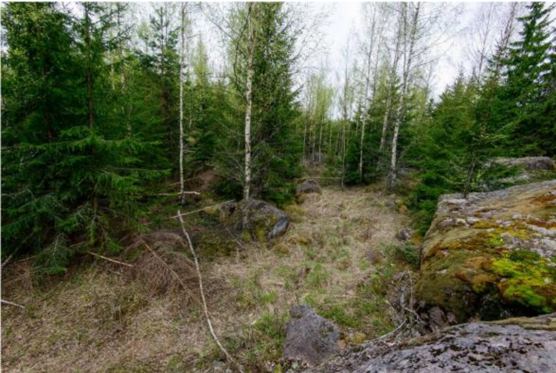
Området för kraftverk nr 6 fotograferat från berget norr om platsen. På området finns tät skog. Foto från norr. (AKDG4244:10)