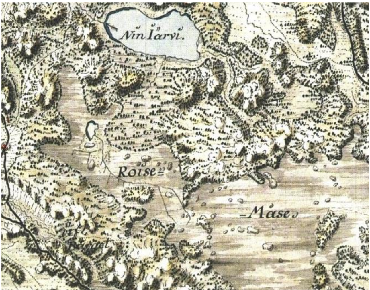
Inventeringsområdet i Kungens kartverk 1776–1805.

Under förberedelserna av inventeringen gjordes en genomgång av tidigare undersökningsrapporter, kartmaterial från historisk tid, verk om socknens historia samt uppgifter i fornlämningsregistret. Det viktigaste källmaterialet i fråga om förhistoria är Museiverkets fornlämningsregister. Med tanke på områdenas potentiella förhistoria utreddes dessutom havsstrandskedena genom rekonstruktion. Enligt historiska kartor finns ännu ingen bosättning på inventeringsområdet, området har varit stenigt och försumpat och har uppenbarligen inte på något sätt lockat till sig bosättning.