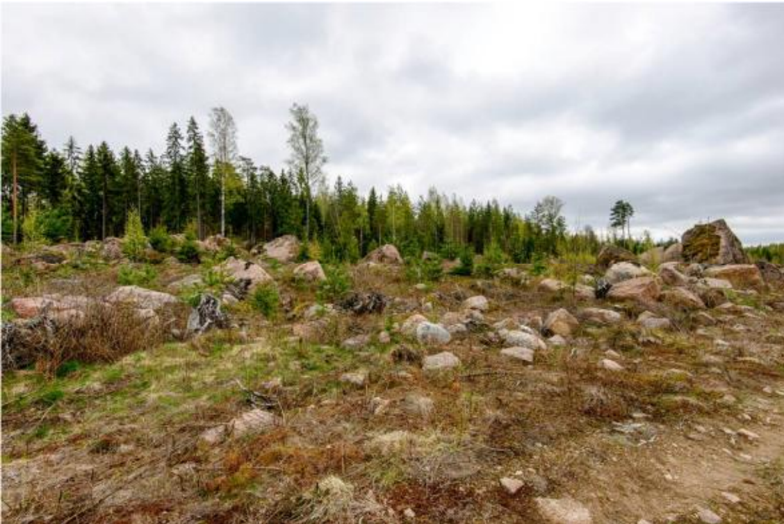
Området för kraftverk nr 9, inventeringsområdets backar är i allmänhet fulla med stenblock. Foto från väster. (AKDG4244:1)