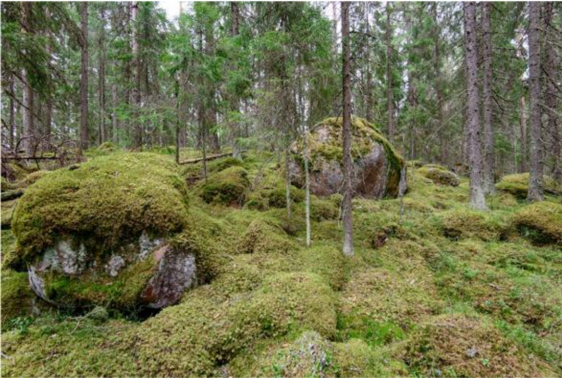
Kraftverk nr 7 byggs på backen med stenblock som syns på fotot. Foto från norr. (AKDG4244:8)