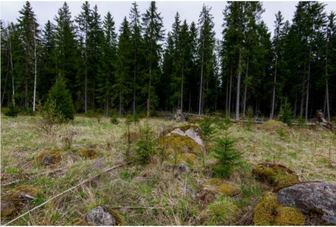
Kraftverk nr 1 byggs i granbeståndet på fotot. Foto från sydväst. (AKDG4244:4)