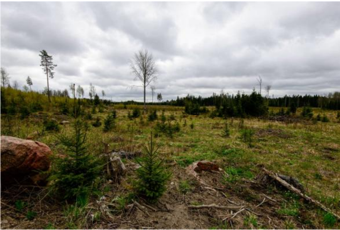
Kraftverk nr 2 byggs på området mitt på fotot. Foto från nordnordväst. (AKDG4244:3)