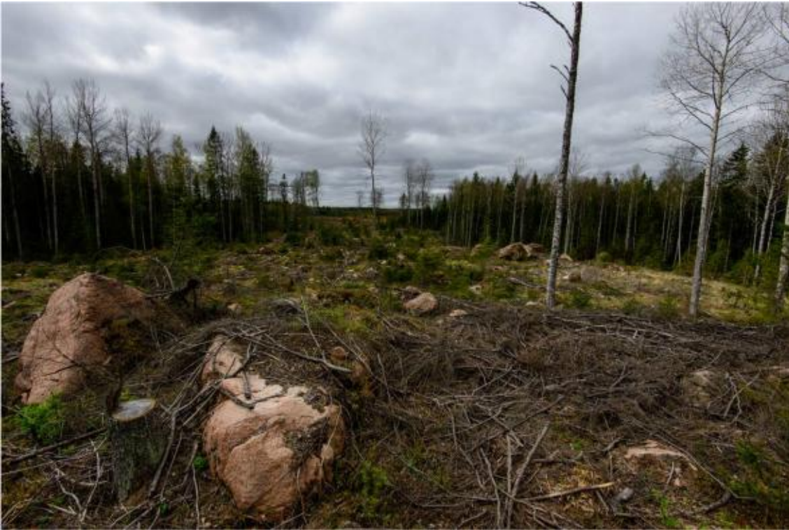
Kraftverk nr 5 placeras nära skogskanten vid fotots högra kant. Foto från nordost. (AKDG4244:6)