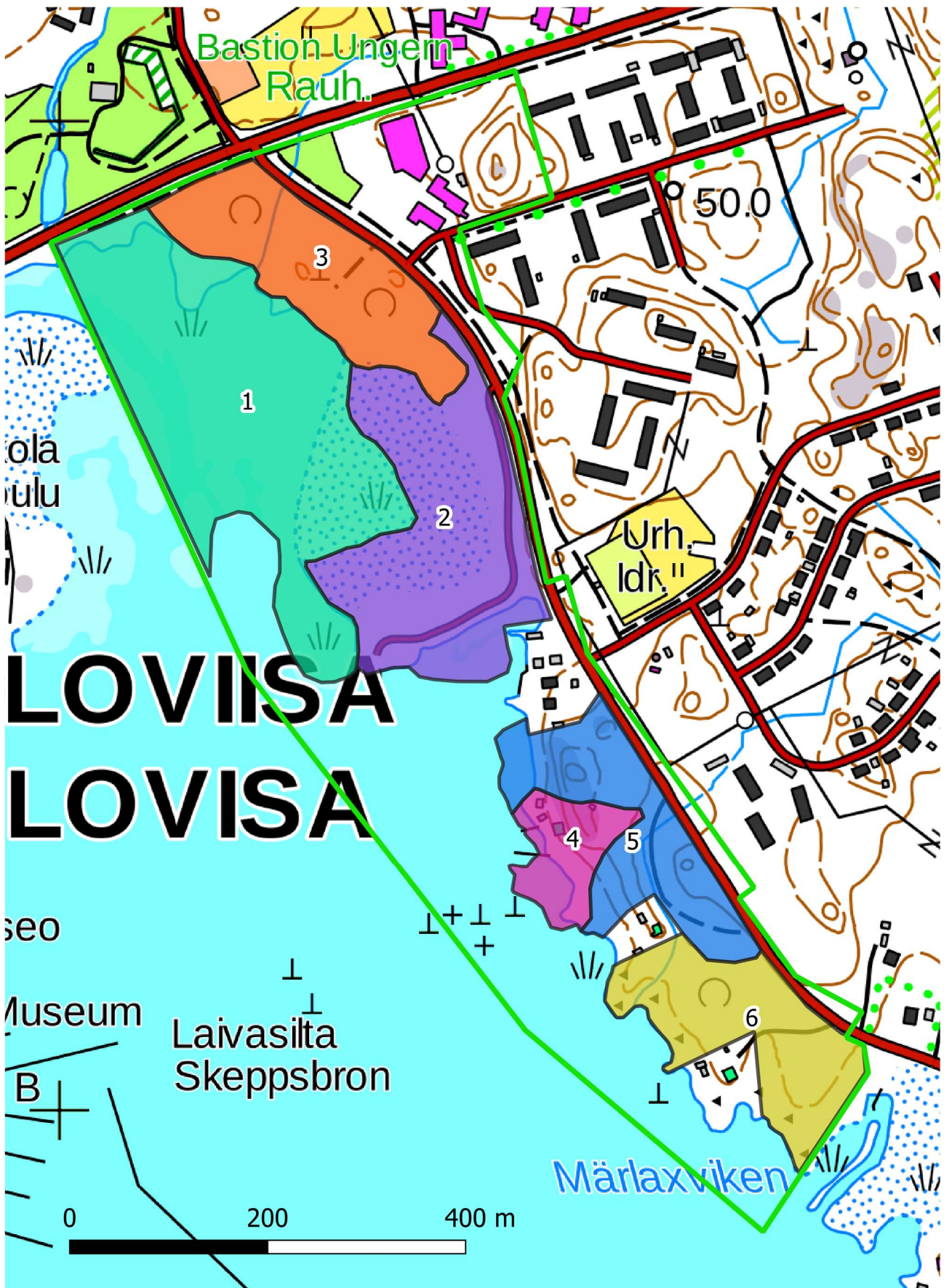
Bild 2. Delområdesindelning av detaljplaneområdet för Drottningstranden. Baskarta: Lantmäteriverkets Baskarta 4/2019.