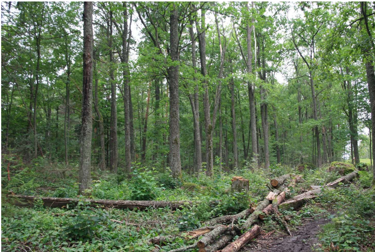
Bild 8. Ekskog i Gröna Udden, delområde 6.

I den norra delen av planområdet finns ett omfattande parkartat avsnitt, som i huvudsak består av övergivet gårdsområde (delområde 3). Parkartat område, som klart och tydligt kan urskiljas från omgivningen, förekommer också i den mellersta delen av planområdet (delområde 4). Arterna med vedstam på de före detta gårdsplanerna inbegriper ett omfattande urval av prydnadsväxter som var populära för cirka ett halvt sekel sedan. Med undantag av vresalm ( Ulmus laevis ) kan alla inhemska ädla lövträd hittas i Drottningstranden, sannolikt ursprungligen planterade. De äldsta individerna av den på planområdet vanliga skogslönnen ( Acer platanoides ) är redan mycket murkna. Det är ytterligare värt att nämna de storvuxna klibbalarna som växer vid utkanten av den övergivna trädgården i norra delen av planområdet.