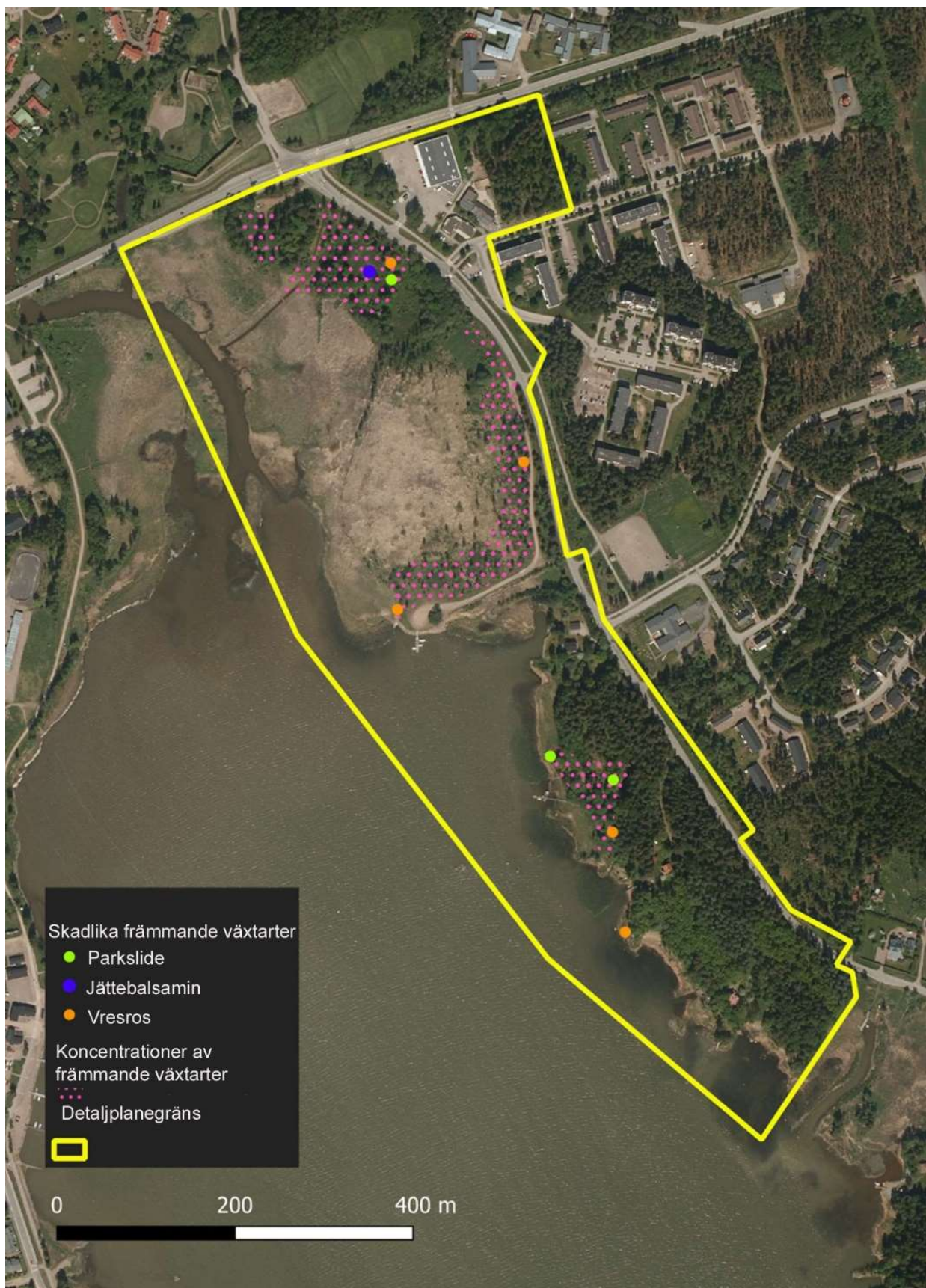
Bild 10. Växtplatserna för de tre mest skadliga främmande arterna i Drottningstranden och koncentrationerna med särskilt rikligt förekommande skadliga främmande arter.