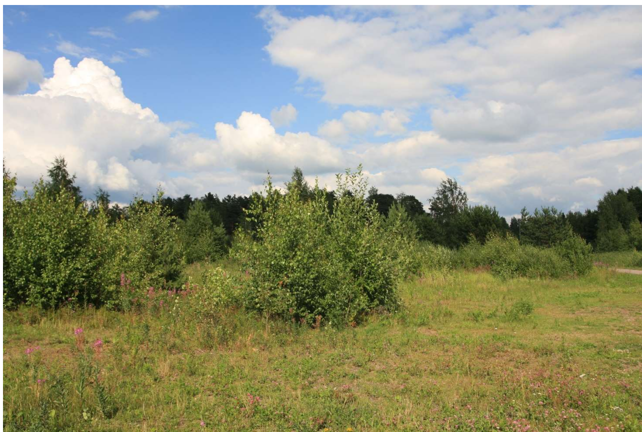
Bild 6. Förbuskad äng på fyllningsjord i delområde 2.