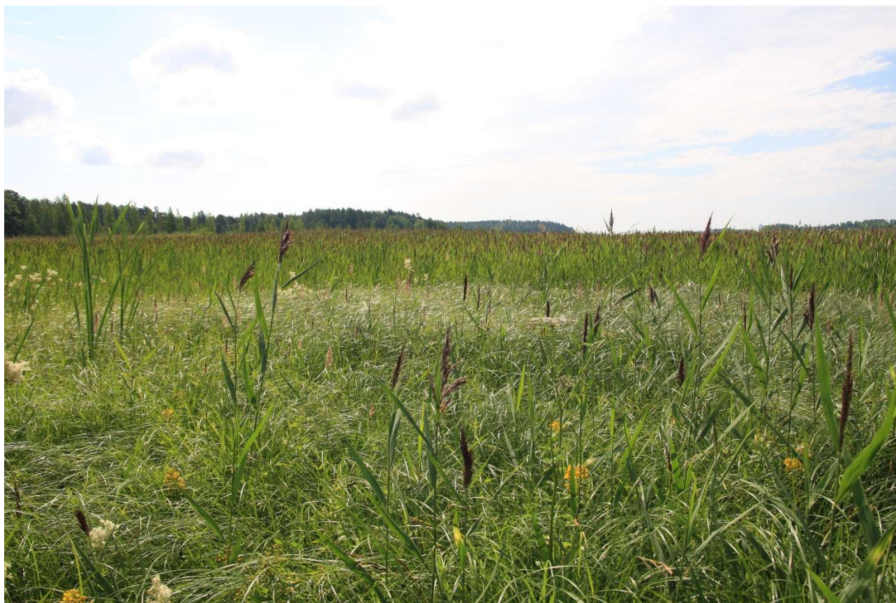
Bild 5. I förgrunden gräs- och starrbevuxet kärr och i bakgrunden täta vassruggar i delområde 1.