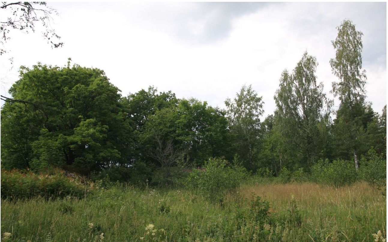
Bild 7. Övergiven gårdsplan i delområde 3.

På området med fyllningsjord, som avgränsar våtmarken i den norra delen av viken, och utmed dess kanter finns vidsträckta, enhetliga ängsartade områden (delområde 2). Utöver detta påträffas ängsplättar av olika storlek på de före detta gårdsområdena. Nästintill överallt är ängarna långt förbuskade och erövrade av annan hög växtlighet. I den norra kanten av vägen till båtbyggnaden förekommer det lågvuxen, torr och relativt mångartad äng där det bland annat växer gul fetknopp ( Sedum acre ), stångfibblor ( Pilosella ), betesdagglåpa ( Alchemilla monticola ), femfingerört (gruppen Potentilla argentea ) och rödklint ( Centaurea jacea ).