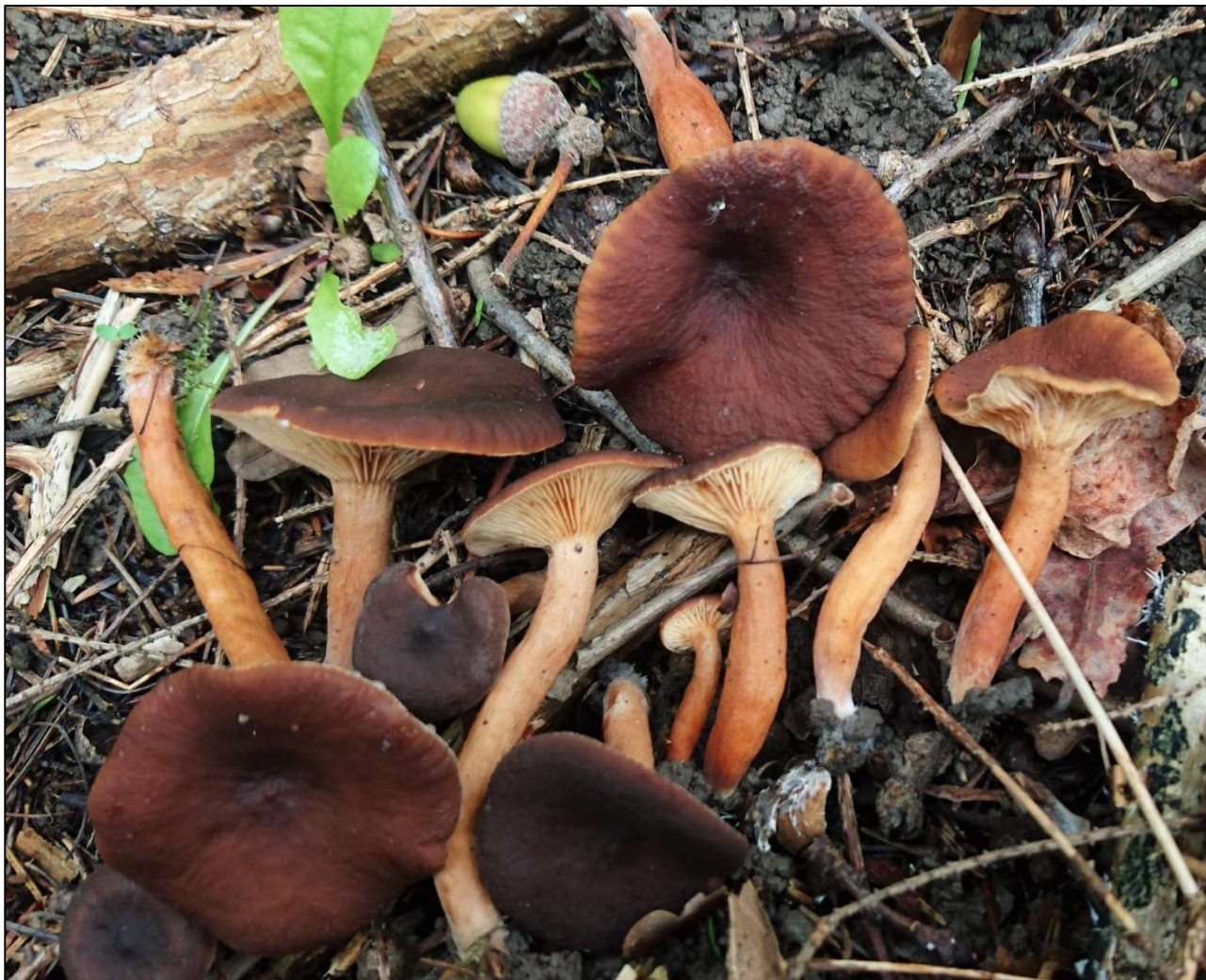
Bild 9. Stinkriska ( Lactarius serifulus ), en sällsynt svampart i detaljplaneområdet för Drottningstranden, vilken ska hållas under uppsikt (NT).

På Drottningstranden har det länge funnits bosättning, och på området finns det åtminstone två övergivna trädgårdar, vilket innebär att en omfattande skara prydnadsväxter med främmande ursprung hunnit sprida sig till naturen. Många av dessa växter finns bland de skadliga främmande arterna i den nationella strategin för främmande arter (Jord- och skogsbruksministeriet 2012) (Tabell 3). I den lövskogsjord som förekommer i rätt stor utsträckning på området frodas många skadliga främmande växtarter. Man fäste särskild uppmärksamhet vid dessa växter i växtinventeringen som utfördes 2018 (Salminen 2018a). Enligt de skriftliga källor som varit till förfogande och enligt uppgifterna i portalen Laji.fi har man inte observerat några andra främmande arter än växter på området.