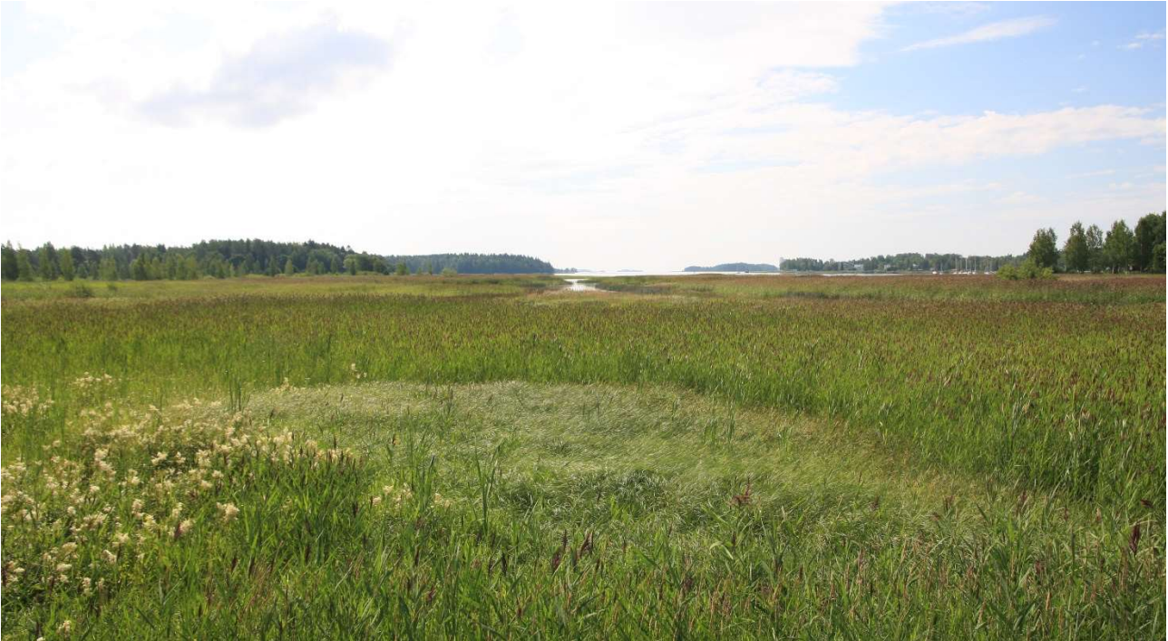
Bild 3. Vy söderut från Lovisavikens innersta del.

Den planterade ek- och lärkträdsskogen i Gröna Udden (delområde 6) urskiljer sig från den omringande skogen som ett avvikande objekt. Platsens landskapsmässiga värden ökar vidare då skogen blir mer varierande till sin struktur i takt med att träden åldras, murkna individer brister och trädplantorna får mer livsrum.