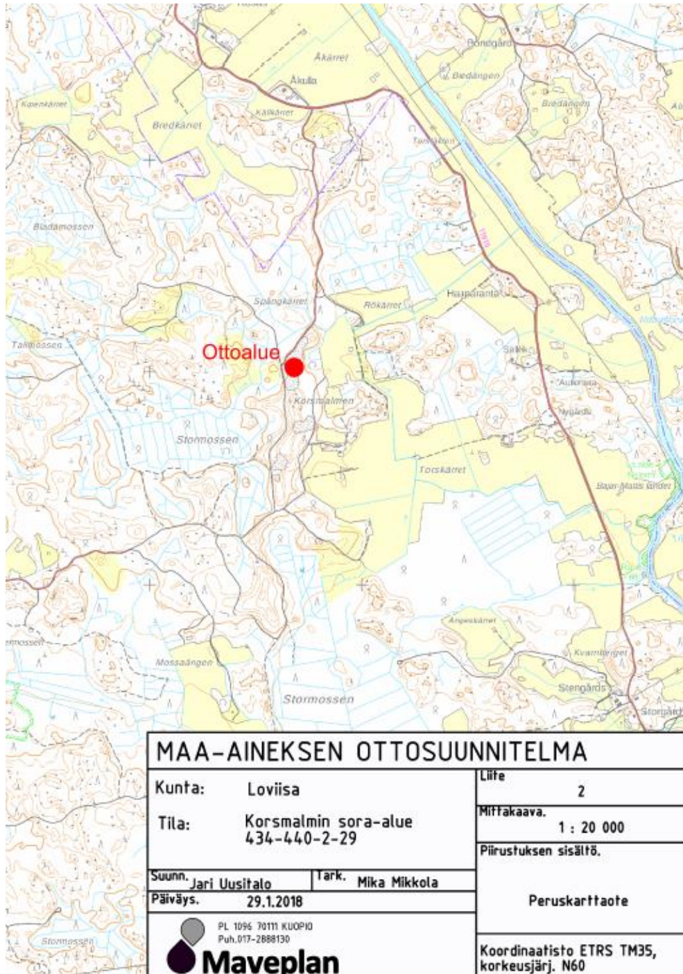
Kuva 1. Ottoalueen sijainti