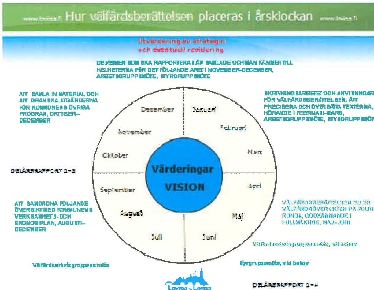
Figur2. Årsklocka för välfärdsplaneringen