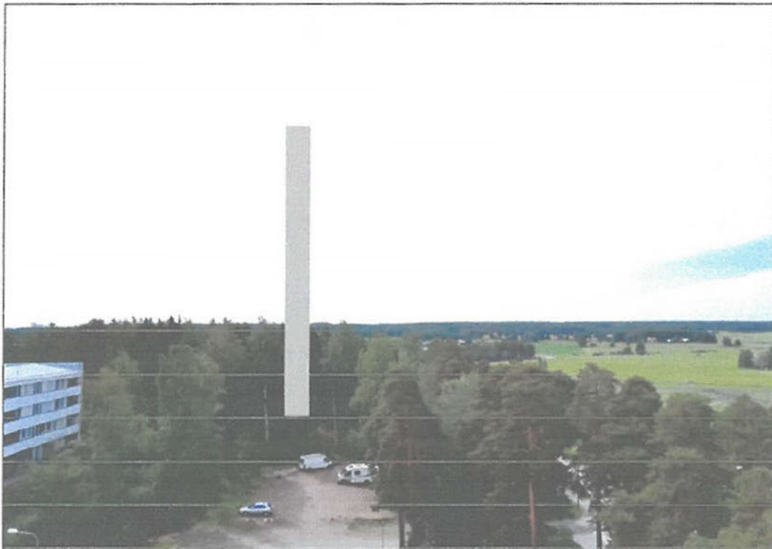
Havainnekuva. LPOnetin antennipylväs Eteläharju 2:n 7.kerroksen parvekkeelta nähtynä.