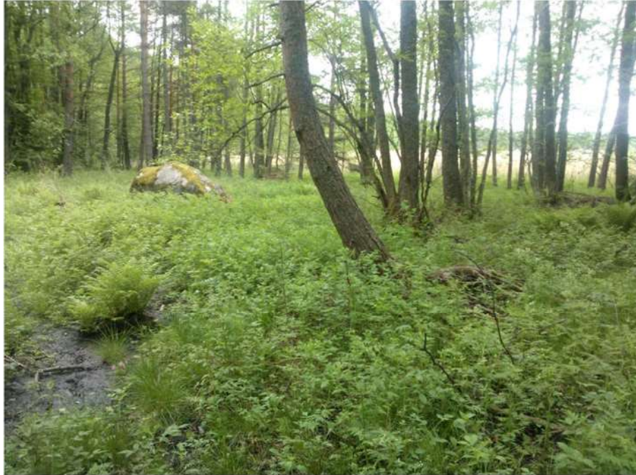
Kuva 4. Braskvikenin (kohde 3) pohjukassa on samoin puna-ailakkityypin luonnontilainen LT-lehto.