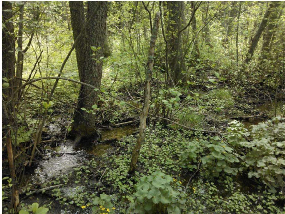
Kuva 2. Kohteessa 1 Haravankylässä sijaitsee monilajinen lehto, jonka läpi virtaa puro. Puro leviää paikoin lähteiköksi. Kohde kuuluu sekä metsä- että vesilain suojeltuihin luontotyyppisiin.

Kohteen läntisellä puolella OMaT-lehdossa pääpuulajina on kuusi. Kenttäkerroksen lajistossa valtalajeina ovat käenkaali, oravanmarja, kielo, korpi-imarre ja metsäimarre. Valkovuokko ja metsäalvejuuri kasvavat paikoin. Huomionarvoisena lajina kuviolla kasvaa myös kaiheorvokki Viola selkirkii , joka on harvinainen, mutta valtakunnallisesti ja alueellisesti kuitenkin elinvoimainen.