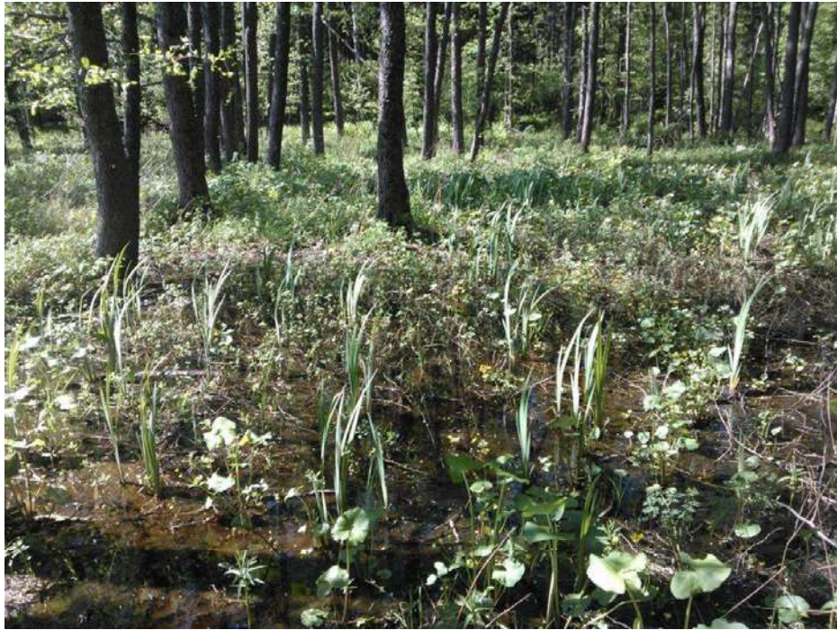
Kuva 8. Tervaleppäkorpi (4 e) Tavistholmenin ja Korsholmenin välissä kuulu myös luonnonsuojelulain kohteisiin ja vaarantuneisiin luontotyyppeihin.