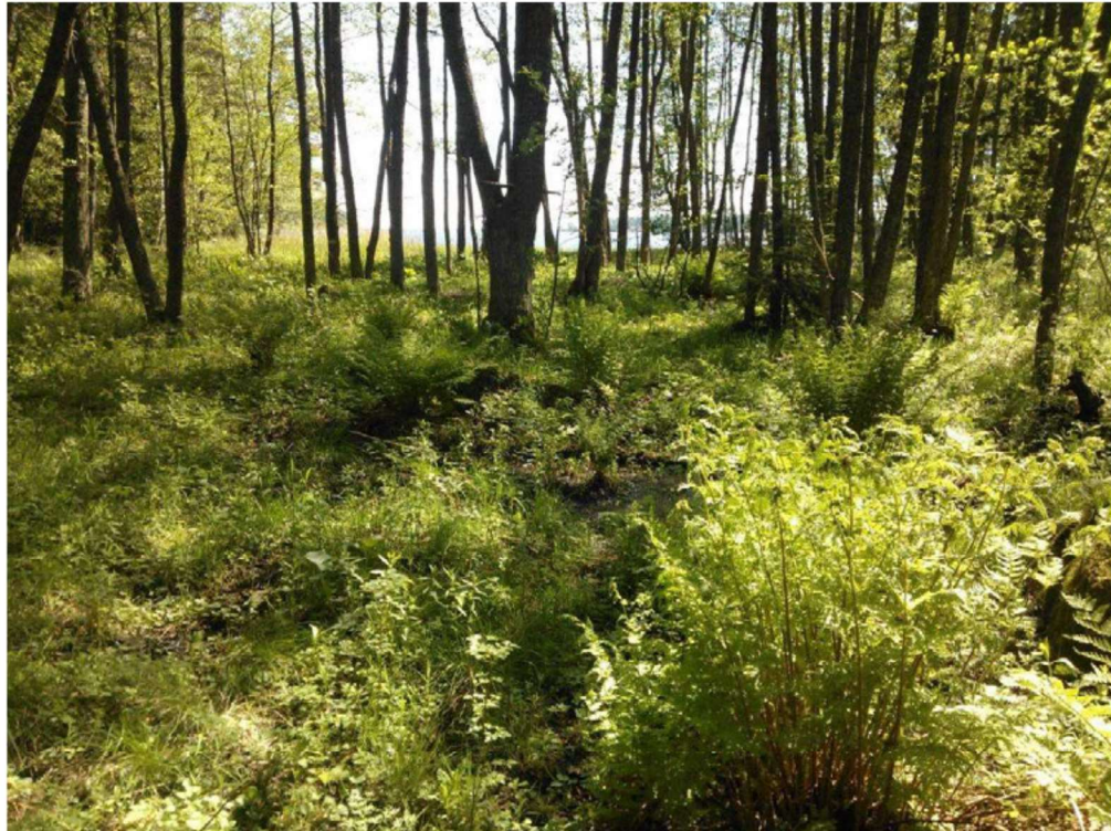
Kuva 9. Tervaleppälehtoa kuviolla 4 f, joka paikoittain vaihettuu tervaleppäkorveksi (kuvio 4 e, kuva 8).