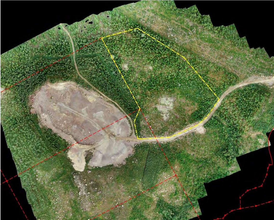
Kuva 1. Alueen nykytilanne, kuvattu dronella 31.8.2022. Suunniteltu ottamisalue rajattu keltaisella viivalla.