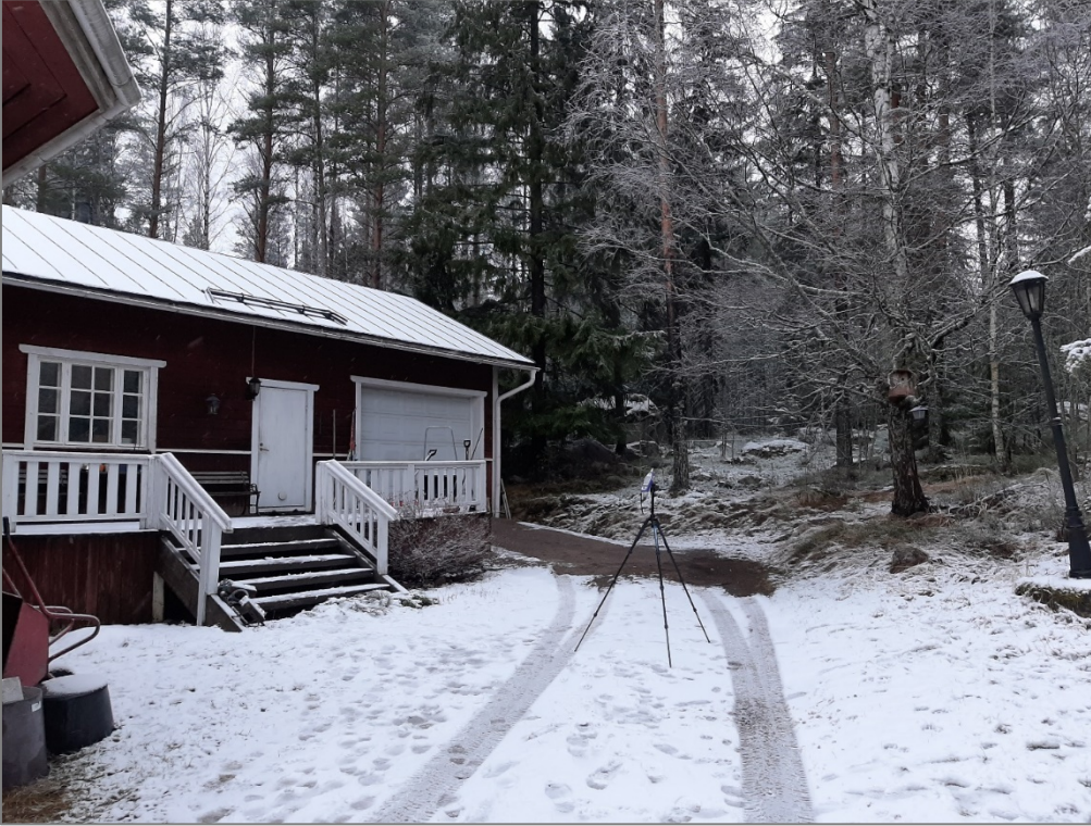
Kuva 1. Valokuva mittauspisteestä.