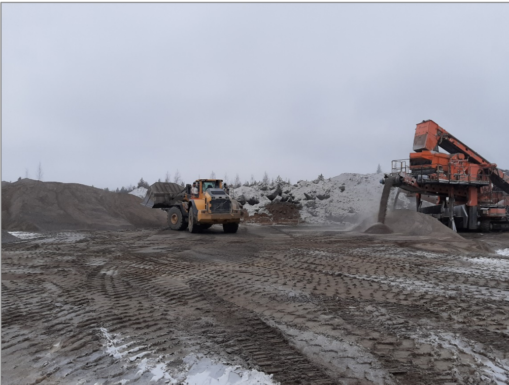
Kuva 4. Mursketta ajettiin varastokasaan pyöräkuormaajalla.