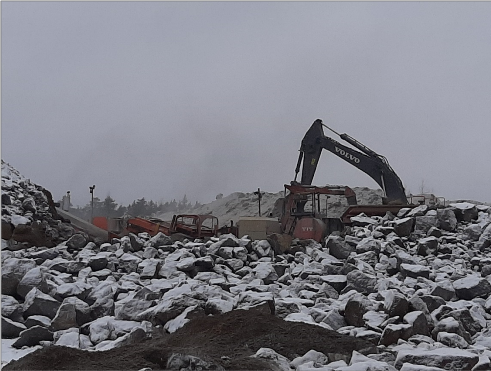
Kuva 3. Toiminta-alueella oleva murskauslaitos ja louhetta syöttävä kaivinkone.