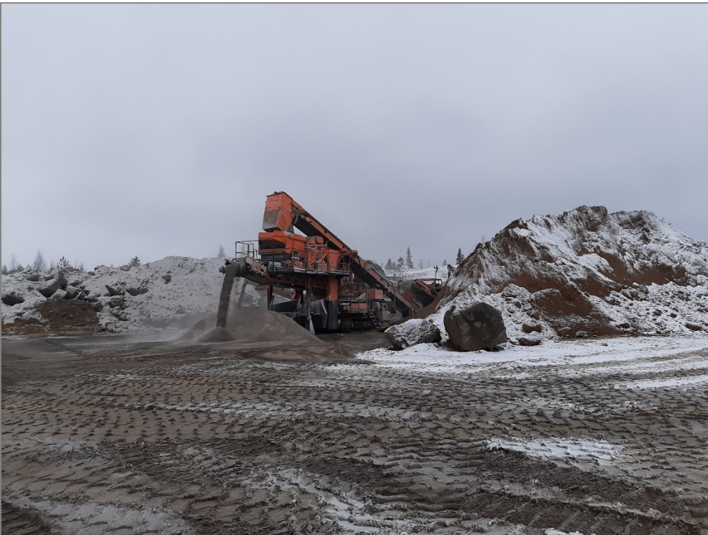
Kuva 2. Toiminta-alueella oleva murskauslaitos.