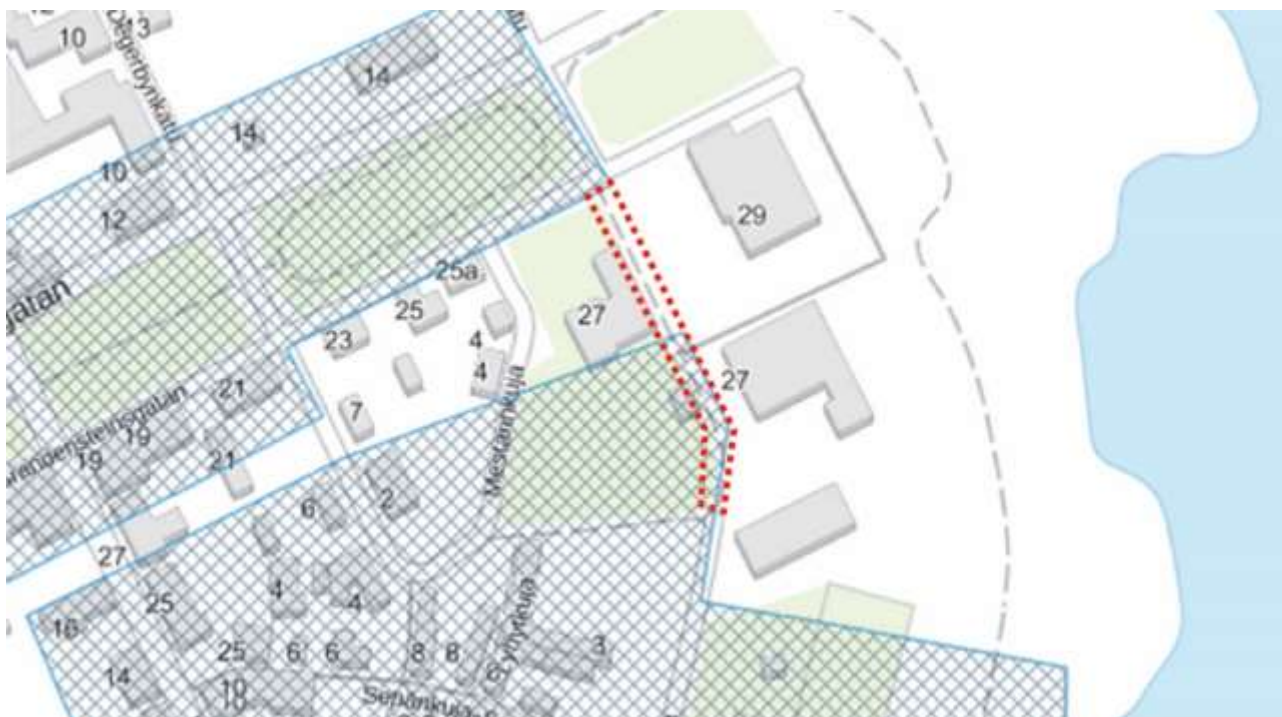
Museovirasto – Valtakunnallisesti merkittävät rakennetut kulttuuriympäristöt, RKY, ja kiinteät muinaisjäännökset