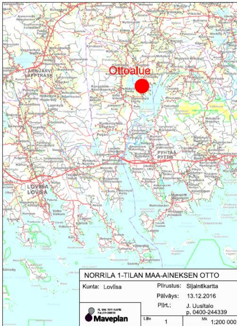
Kuva 1. Ottoalueen sijainti

Suunnitelma-alueen eteläpäässä ottaminen ulottuu tilan Santakuopat 434-480-878-2 puolelle, jossa on tarkoitus maisemoida vanhan ottotoiminnan aikainen alue. Alueella ei ole ollut enää ottotoimintaa ja sitä on osittain täytetty. Ottoalueen läpi kulkee myös tieyhteys tilalle Tallbacka 434-480-3-4.