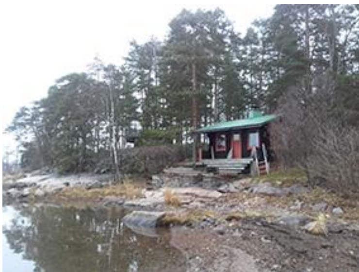
Kuva 6. Rakennuspaikan maastoa.