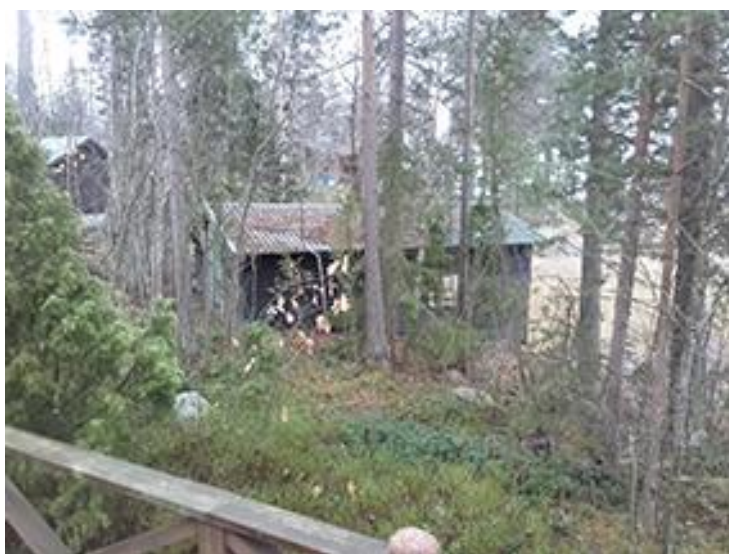
Kuva 7. Rakennuspaikan 2. venevara.