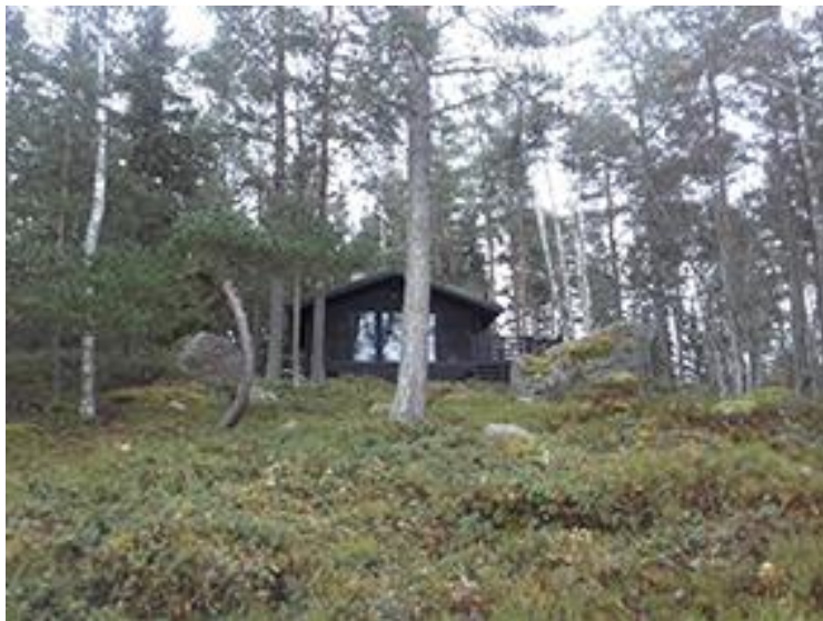
Kuva 5. Rakennuspaikan 2. vierasmaja.