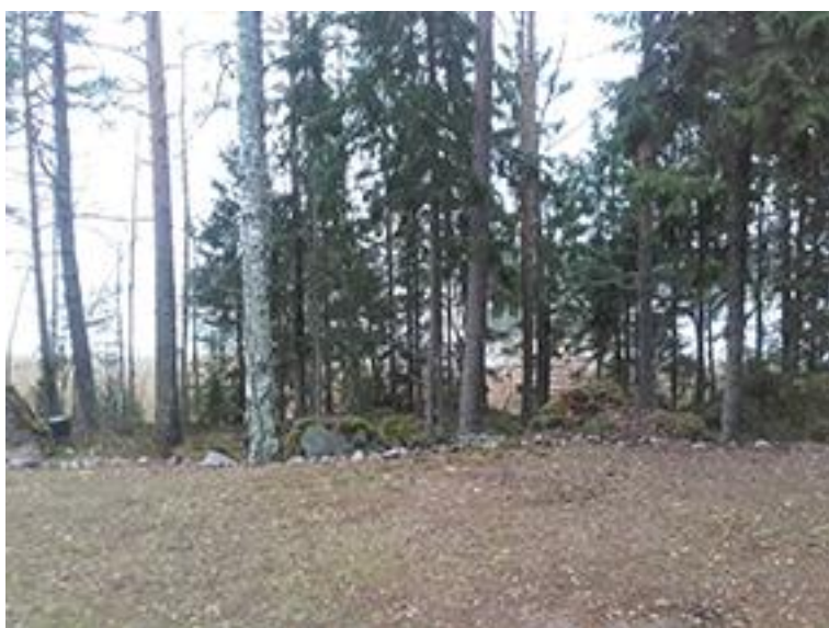
Kuva 3. Edellisen kuvan rakennuksista itään oleva ranta.