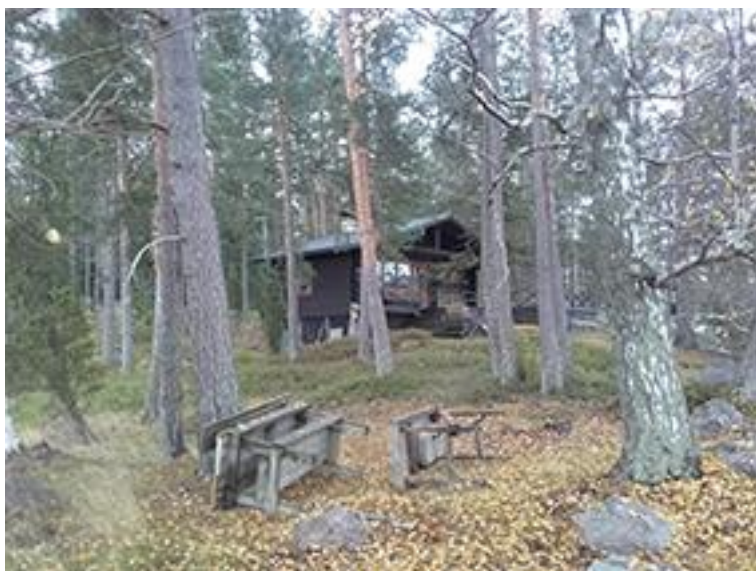
Kuva 1. Rakennuspaikan 1. lomamökki.

Seuraavassa on kuvasarja rakennuspaikoista.