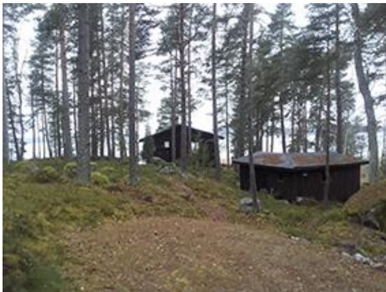
Kuva 2. Rakennuspaikan 1. mökki ja liiteri rantaan päin kuvattuina.