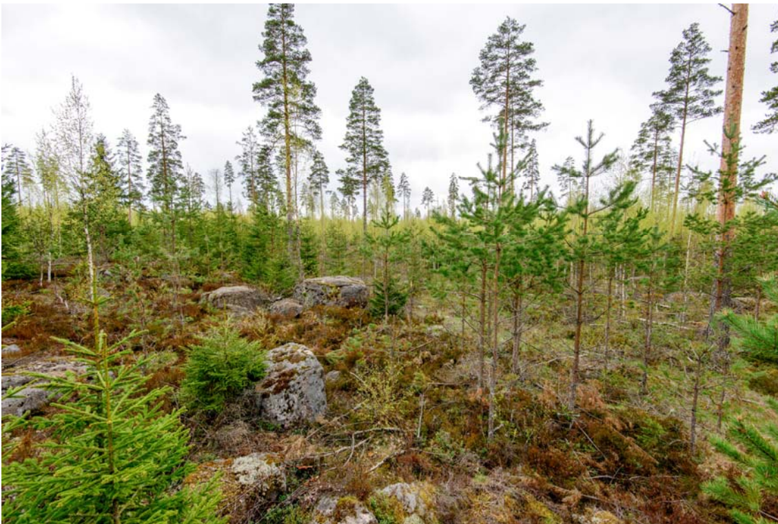
Voimala nro 4, maisemaa voimalan kohdalta etelään. (AKDG4244:2)