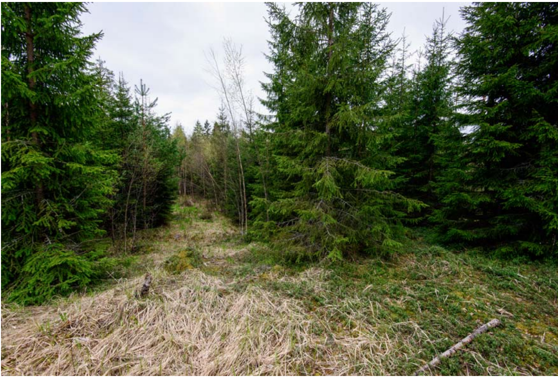
Voimala nro 3 paikka sijaitsee tiheässä nuoressa sekametsässä. AKDG4244:5