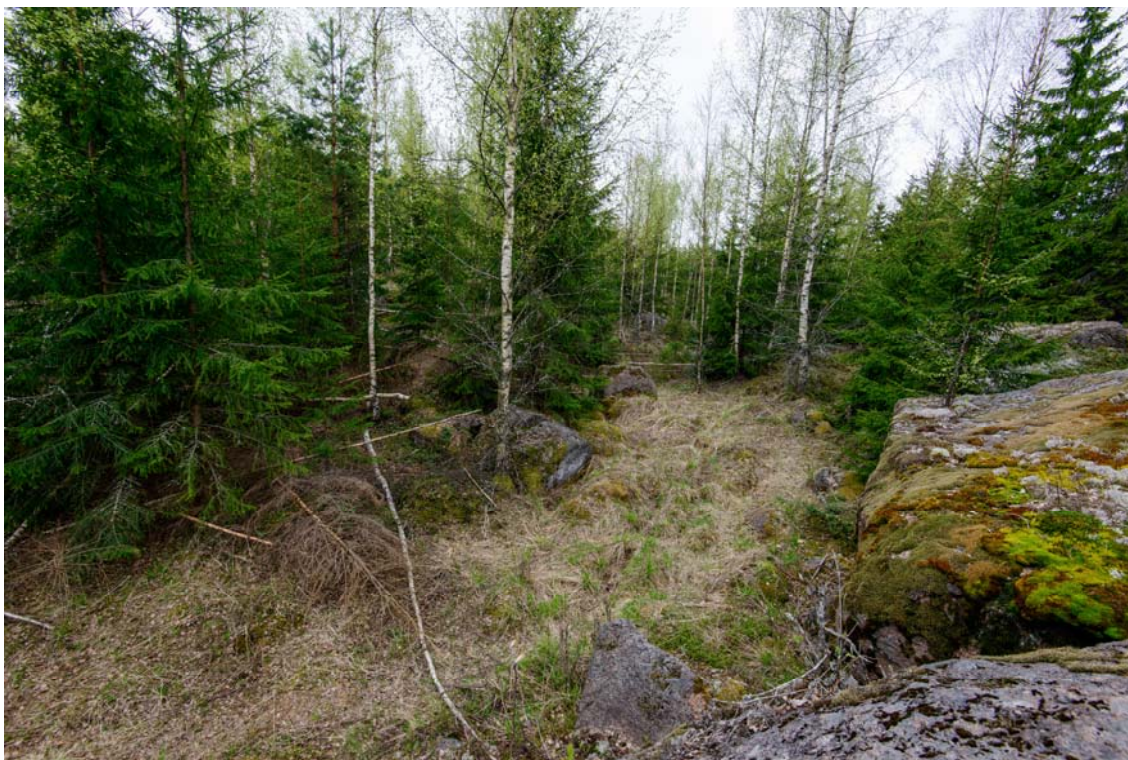
Voimalan nro 6 aluetta kuvattuna sen pohjoispuoleiselta kalliolta. Alue kasvaa tiheää metsää. Kuva pohjoisesta. (AKDG4244:10)