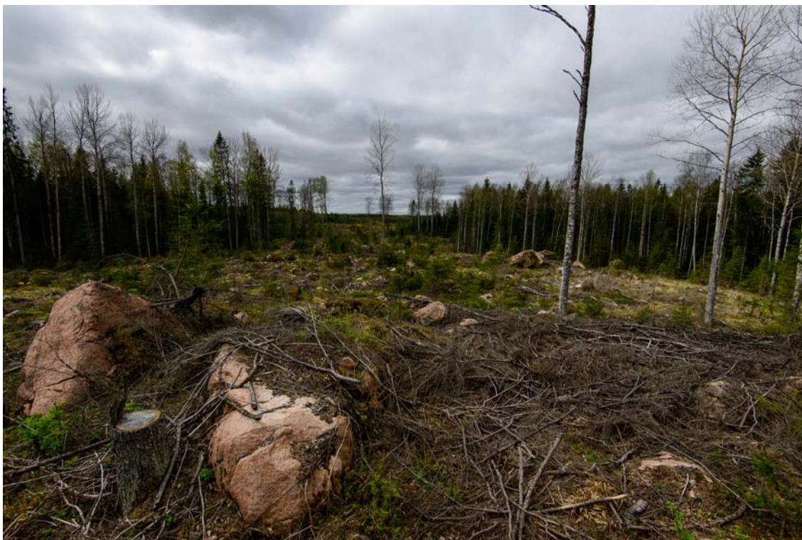
Voimala nro 5 on sijoitettu kuvan oikeassa laidassa olevan metsänrajan tuntumaan. Kuva koillisesta. (AKDG4244:6)