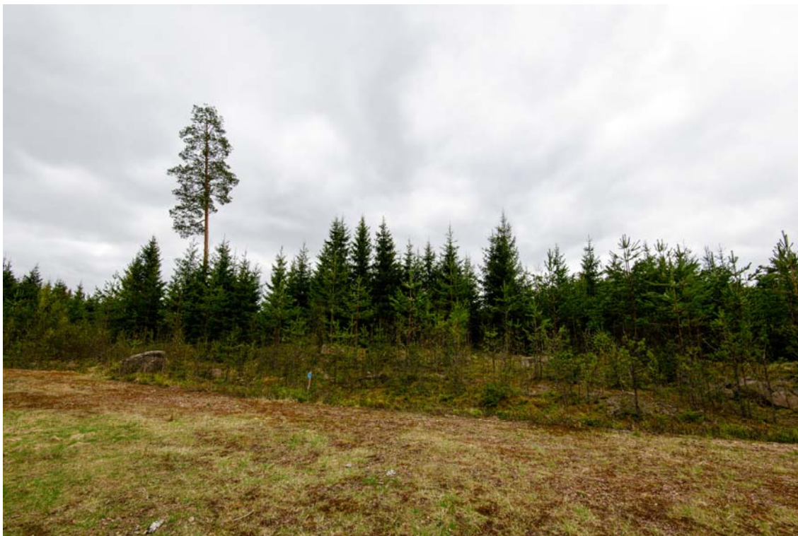
Voimala nro 8, sijaitsee metsätien päässä olevalla mäellä. Kuva pohjoisesta. (AKDG4244:7)