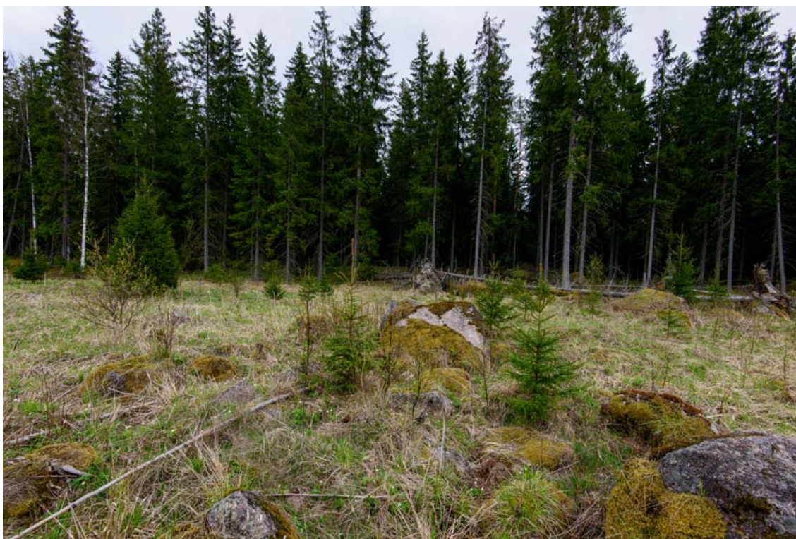
Voimala nro 1 rakennetaan kuvassa olevaan kuusikkoon, kuva lounaasta. (AKDG4244:4)