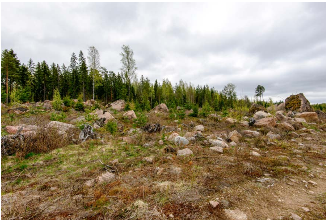
Voimalan nro 9 aluetta, inventointialueen mäet ovat yleensä täynnä lohkareita. Kuva lännestä. (AKDG4244:1)