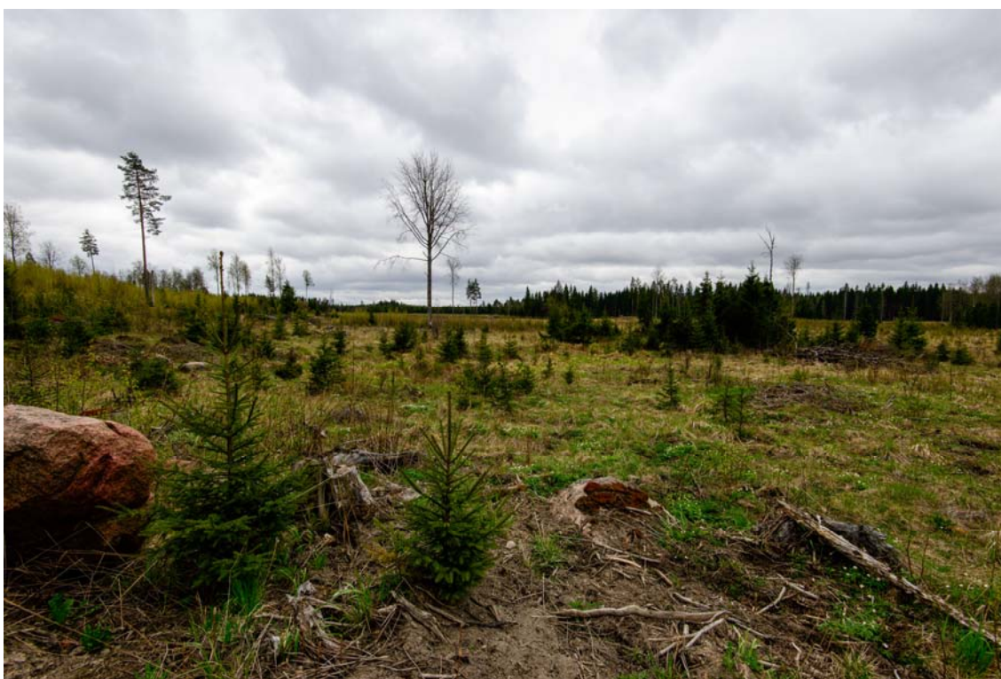
Voimala nro 2 rakennetaan kuvan keskiosassa näkyvälle alueelle, kuva pohjoisluoteesta. (AKDG4244:3)