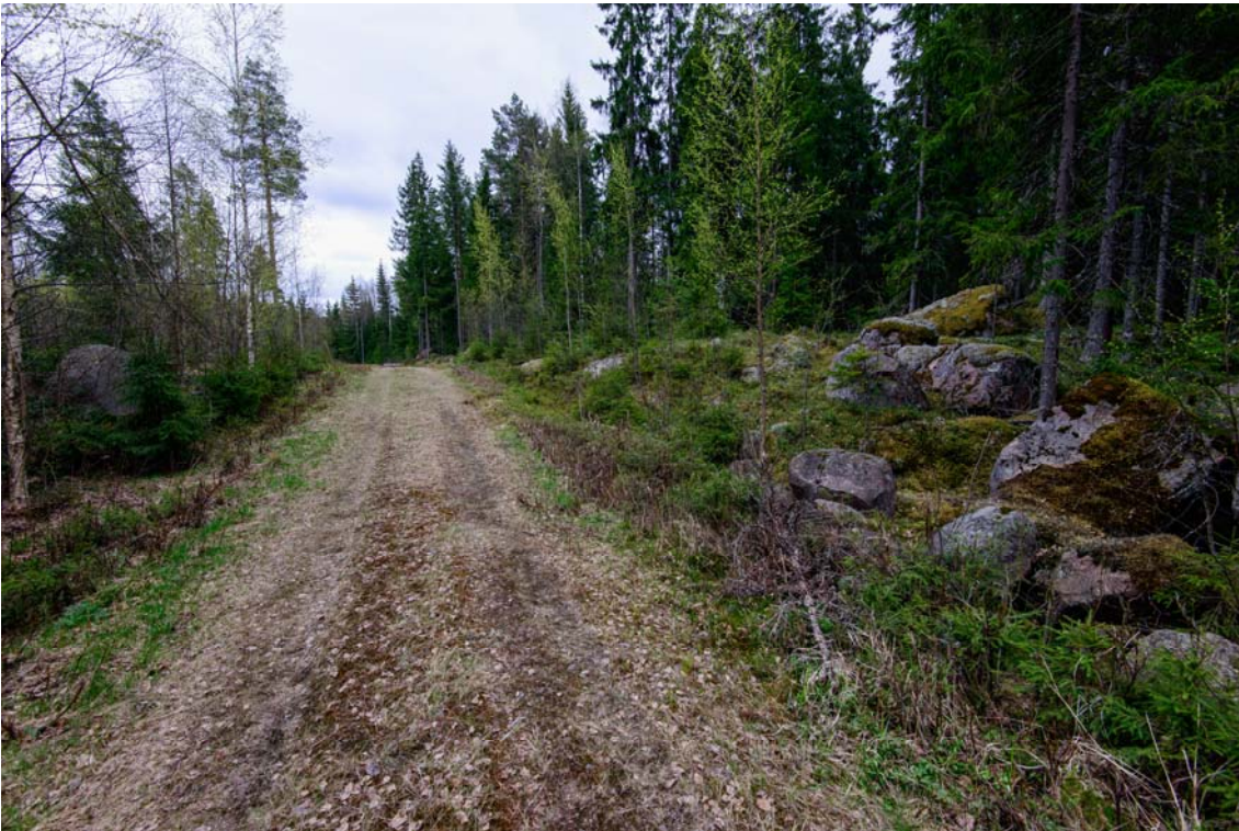
Metsäautotie voimalan 7 kohdalla. Kuva luoteesta. (AKDG4244:9)