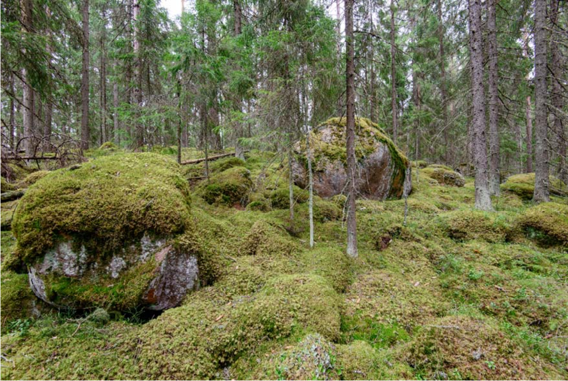
Voimala nro 7 rakennetaan kuvassa olevalle louhikkoiselle mäelle. Kuva pohjoisesta. (AKDG4244:8)