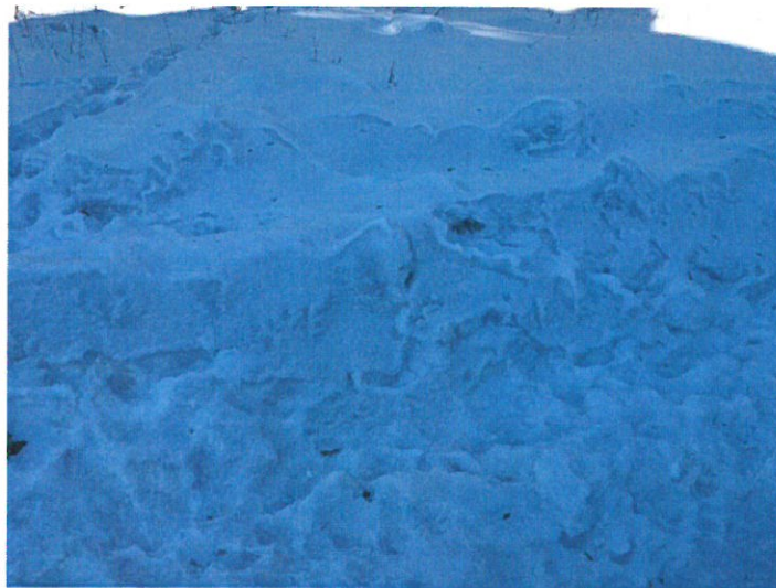
Eestintie 1, kiinteistön 1:13 suuntaan, oli selvästi havaittavissa mustanharmaata hiilipölyä lumessa.