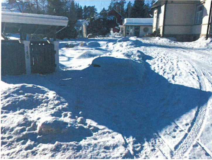
Svenäsintie 148 kohdalla, kiinteistö 1:36, oli havaittavissa mustanharmaata hiilipölyä lumessa.