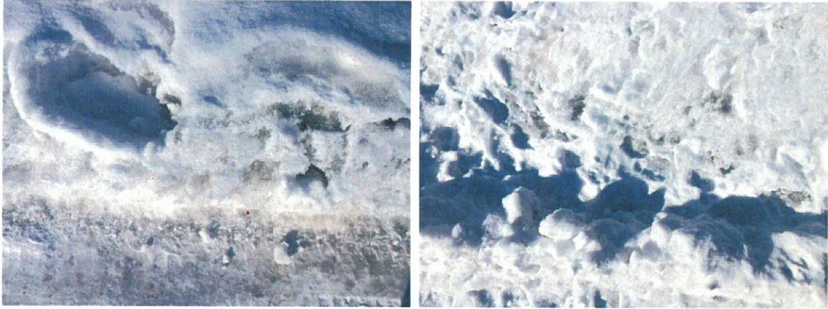
Eestintie 10 ja 2 välillä oli selvästi havaittavissa mustanharmaata hiilipölyä lumessa.