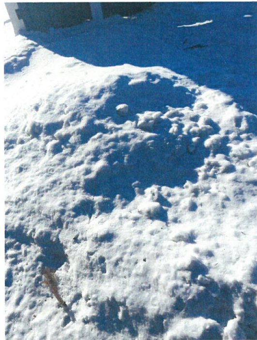
Kiinteistön 1:190 piha likaantunut hiilipölyllä. Kuva oikealla: Svenäsintieltä katsottuna, kiinteistö 1:36, jossa oli myös havaittavissa mustanharmaata hiilipölyä lumessa, vaikka kuvassa pöly ei selvästi näy.