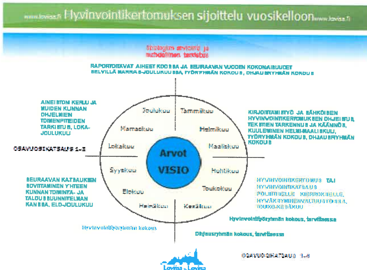
Kuvio 2. Hyvinvointisuunnittelun vuosikello